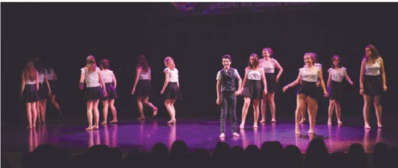
DBH1 eta DBH2 mailetako gazteek dantzari trebeak direla erakusteko aukera izan zuten asteazken goizean.