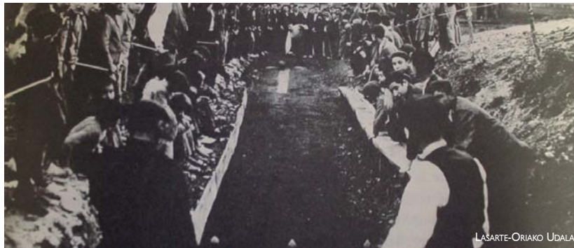
Herritar ugari biltzen zen lehen bola-joko txapelketetan. Asteburu honetan ere, Euskadiko txapelketarekin horrela izatea espero da.