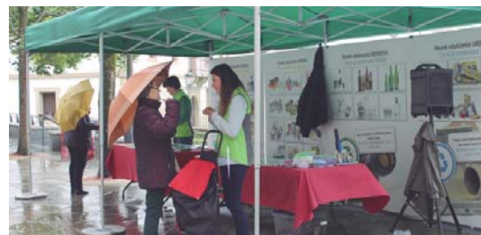
Birziklapen informazio karpa izango da gaur arratsaldetan ere Okendo plazan.

Honetaz gain, energia berriztagarriak ere landu nahi izan ditu Udalak eta Goiener energia kooperatibak, Kultura