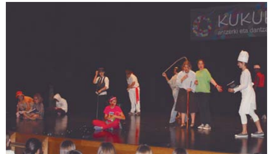
Besteak beste, LH1, LH2, LH3 eta LH6 mailetako antzerkiak ikusi dira aste honetan.