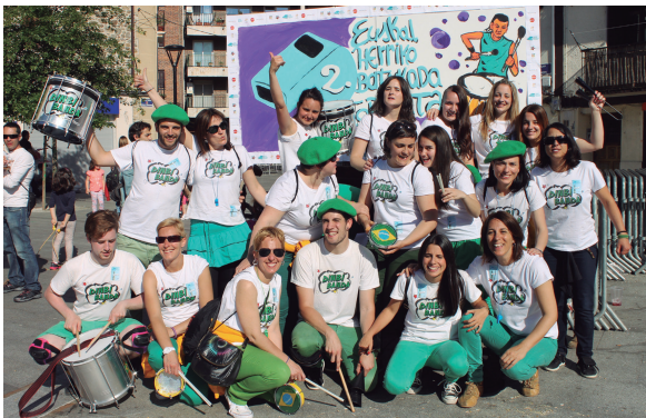
Iazko eguraldi txarraren arantzaxoa atera eta gustura atera zuten argazkia Dinbi-Bandako kideek, eguzkipean.

Goizeko egitarauari dagokionez, Zumaburun, Atso-bakarren, Sasoetan, Erdigunean eta Okendo plazan bertan aritu ziren eskeletoak eta ipurmasailak mugitzen eguerdian txupina botatzeko ordua iritsi zen arte.