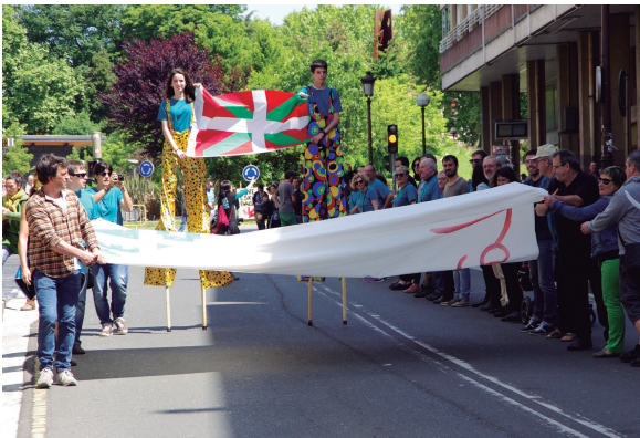
Kale Nagusian osatu zen giza-katean jai giroa izan zen nagusi.