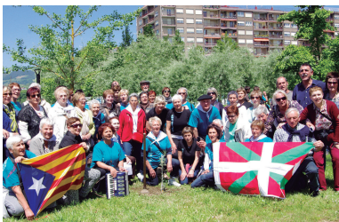
Xumelakoek Kataluniatik ekarrirako olibondoa landatu zuten.