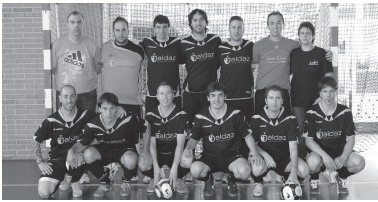
Aldaz HK-ek taldea babesteari utziko dio. Balteke taldearen azken argazkia izatea.