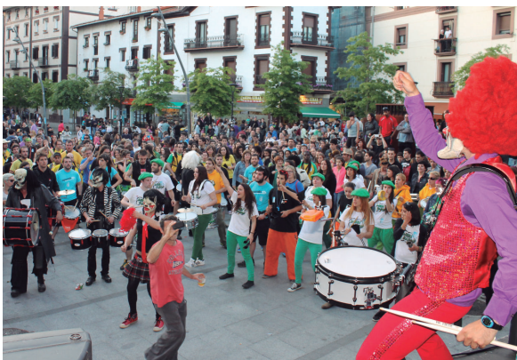
Ixura hauxe zuen Okendo plazak arratsaldeko emanaldiaren orduan. Kolorea eta alaitasuna. 2014ko maiatzaren 16ra arte!