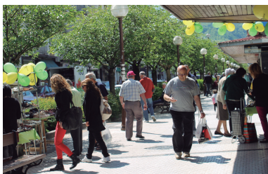
Dendek produktuak eskaintza bereziki ateratu zituzten kalera.