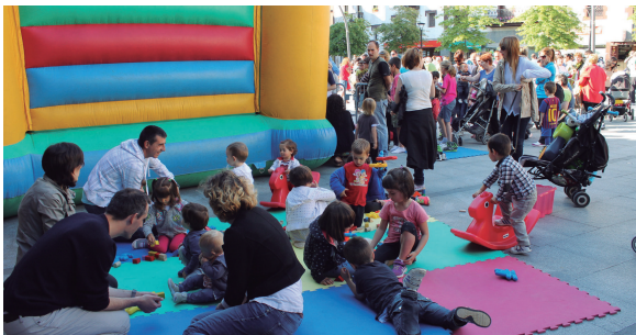
Haurrentzako ekintzek arrakasta handia izan zuten Aterpearen Udaberriko festan.