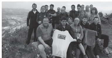
Xirimiri elkartearen hainbat lagunek Buruntza mendira egin zuten txangoa larunbatean.

25 bat pertsona bildu ziren elkartearen. Giro ede-