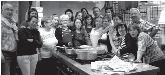
Banaiz Bagara eta Solaskide egitasmoak "Munduko arrozak" ikastaroa eskaini zuten ostegunean Xirimiri elkartearen.