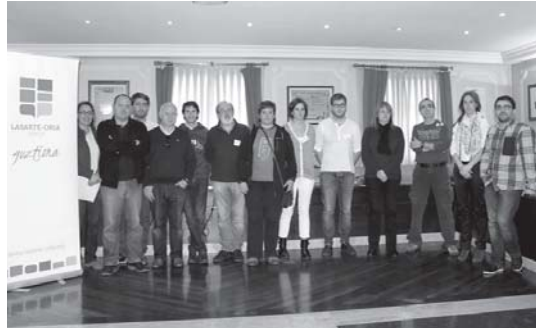
Udalbatzar kideek genero biolentziaren aurkako mozio bateratua aurkeztu zuten.

Asteartean, ohiko udalbatzarra burutu zen. Honetan 2013 urteko ekitaldiari amaiera emateko hainbat ekonomia kontuen berri eman zen. Landaberrigaraikoetxean jangela eraikitzeke lehen pausoa eman da eta genero indarkeriaren aurkako premiazko mozioa ere aurkeztu zuten alderdi guztiek.