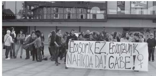
Hainbat herritar eta zinegotzi bildu ziren asteazkenean Okendo plazan.

Horretaz gain, asteburu honetan ere, beste eraso bat gertatu zen herrian, kasu honetan Errenterriko bikote bat. Gizona bere bikotea bortxatzen saiatu zen eta honen erresistentzia dela eta jipoitu egin zuen eta kotxearekin