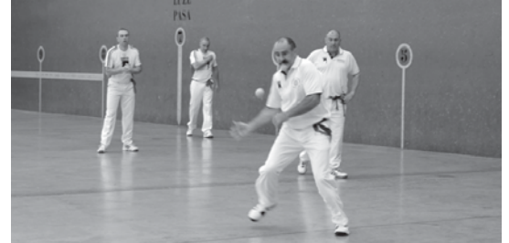
Gaztetxo, beterano eta aurten emakumeek ere jokatuko dituzte finalak San Pedro Jaietan.

Hauek pilota goxoarekin eta 22 tantora jokatuko dituzte partidak.