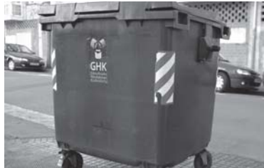
5.edukiontzia martxan jarriko da.

Berehala Mankomunitateko presidenteari helarazi zaio erabakia "Mankomunitateak