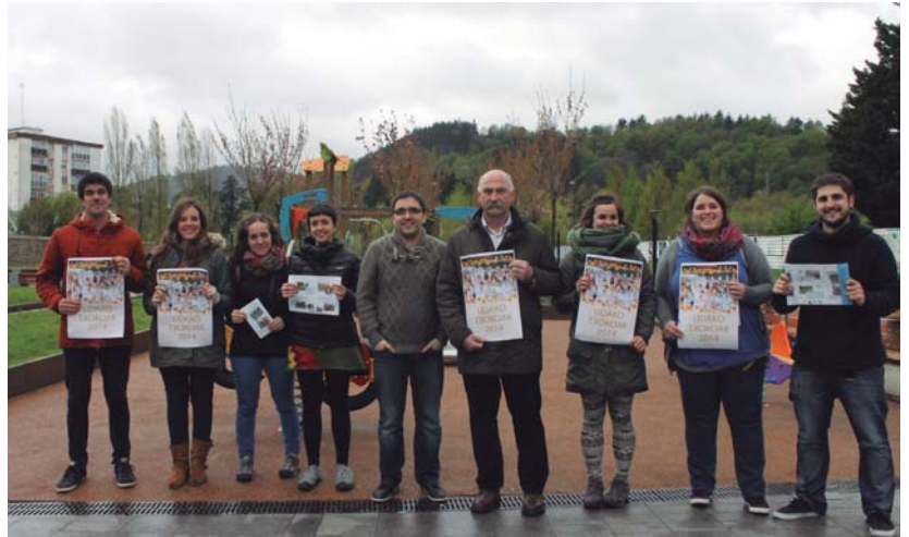
Eguraldi txarrari aurre eginez, udako oporraldietarako aisia eskaintza aurkeztu zuten.

Izena emateko epea zabaldu da eta Ttakuneko bulegoan egin daiteke. Udako Txokoen kasuan, astelehenean aurrera egin ahal izango da.