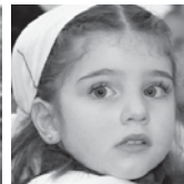
Uxue Zorionak bitxito zure laugarren urtebetetzean. Muxu handi bat familiaren partetik!