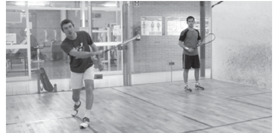
Astelehenean XXVI. txapelketako lehen bi partidak jokatu ziren kiroldegian.

Lehenengo astelehenean hasi eta maiatzaren 26an amaituko da. Itzuli bakarrek ligaska sistema erabiliko da