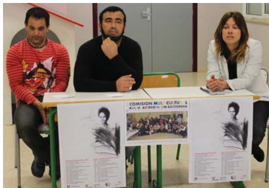
Euren esperientziak kontatu zituzten guraso batzuek.

riak aipatu zuenez, "gure kulturaren egoera ikusita, oso garrantzitsua da horrelako lana egitea" eta gurasoei gai honetan lanean jarraitzeko eskatu zien.