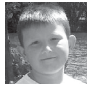
Unai Zorionak maitia. 7 txokolatzeko muxu familia guztiaren partetik.