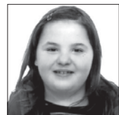
Eluxka Zorionak zure bederatzigarren urtebetetzean. Oso ondo pasa aita-ama eta familiaren partetik.