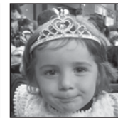
Malen Zorionak printzesita. Ondo-ondo pasa familiaren partetik. Muxu handi bat.