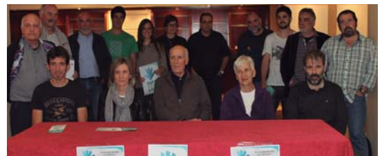
Asteartean egindako agerraldian hainbat herritarren babesa izan zuten antolatzaileek.