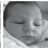
Iزارo Zorionak lñi eta Ainhoa! Ongi etorri Iزارo gure artera