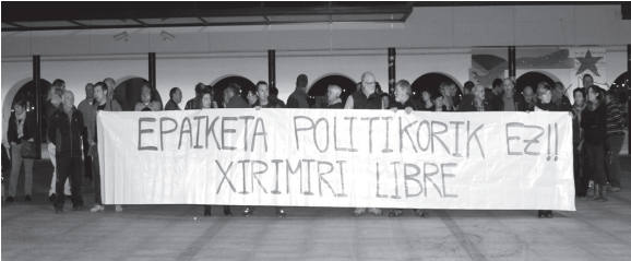
Okendo plazan egin zen asteazkenean elkarretaratzeta.

Herriko tabernen epaiketa bukatuta, erabakiaren zain dago