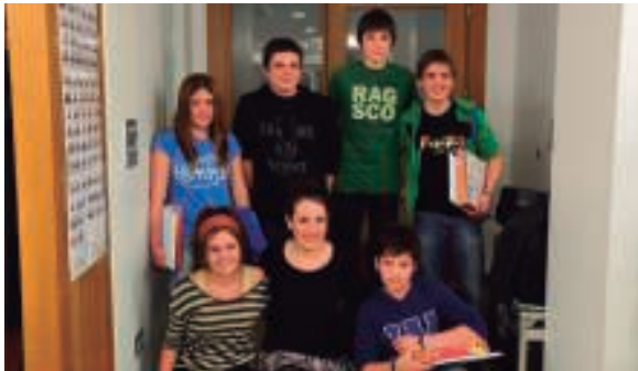
Arrieskallean egindako afari-merienda ostean bat-bateko bertso-saioan aritu ziren gazte gipuzkoarren talde-argazkia.

Gipuzkoako Eskolarteko txapelketaren 34. edizioa da honakoa, baina txapelketa eraberrituta dator aurtur.