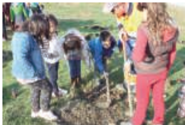
Haurrek ederki egin zuten haien lan aitzurra eta irakasle eta lorezainen laguntzaz.

Goiz ederra igaro zuten Goiegiko mendi magalean.