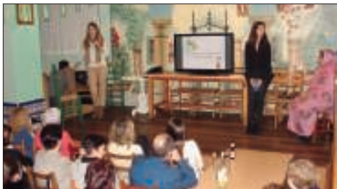
Batez ere emakumeak hurbildu ziren ostiraleko hitzaldia, ostein afaria egin zuten.

Eta ekimen honen barruan egindako bertso-paperekin saioa izango dutela aurreratu du Muñok, "bi ikastetxeetako lanak aztertuko dira eta maiatzean egin ohi den Aholkotasun jaialdian lan onenak sarituko ditugu".