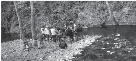
Ekintza guztien artean mendi irteera ere egin zuten mintzalagunek iaz Etxalarren.

Euskal Herri osoko solaskideentzat Etxalarrera irteera