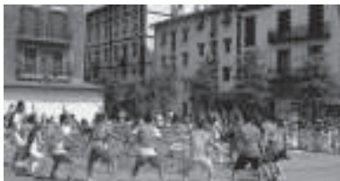
Izena emateko azken eguna apirilaren 10ean.

Begirale ugari behar dira batez ere udako txokotarako.