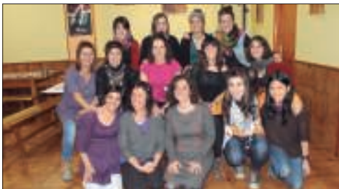
Lasarte-Oriako emakume desberdinen talde batek bazkaria egin zuten Xirimiri elkartean.