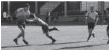
Beltzako mutiak errebanxa gogoz zelairatu ziren.