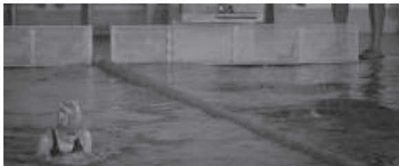
Buruntzaldea IKFko alebin eta benjaminak ederki ibili ziren Lasarte-Oriako jardunaldian.

Partida hau baino lehen sailkapeneko 7. postuan zegoen herriko taldea eta gertu zituen 5. eta 6.n dauden Inter Eder eta Elorriko Buskantzak. Oscar Garciaeren mutilek 7 jardunaldi dituzte maila mantentzeko, ez dute lan zaila izango izan ere beheko postuetatik urrun baitago taldea.