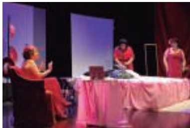
Lan eta Lan antzerki taldearen obran kolore gorrixak izan ziren nagusi.