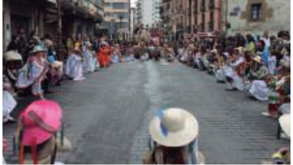
Kale Nagusian gelditu zen desfilea bertan dantzak egiteko, ikusleek txalo zaparrada eskaini zieten dantzariari.