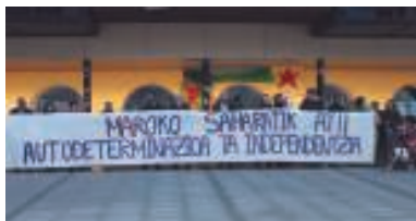
Saharar herriaren lagunek elkarretaratzea egin zuten ostegunean.