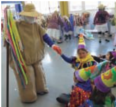
Miel Otxin eta Zaldikoren bisita jaso dute Garaikoetxean.