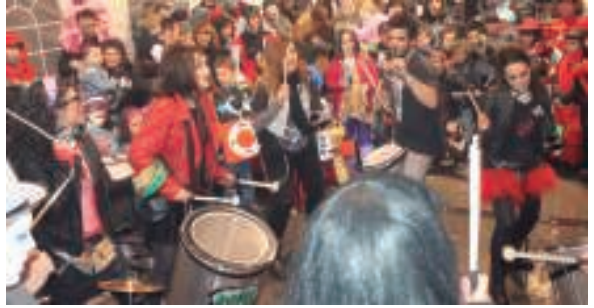
Dinbi Banda rock bandak dantzan jarri zuen Okendoko karpa larunbat arratsaldean. Hori festa giroa!