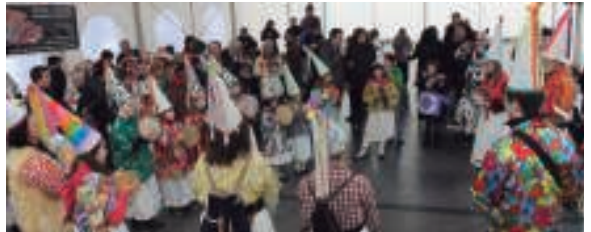
Amalur eskolako musikariek girotu zuten hamaiketako eta desfilea.