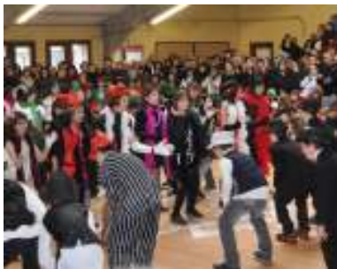
20ko hamarkadako jantzi eta dantzak Landaberrin.