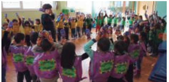
Zumaburuko Sanba taldeak ederki astindu zituen gerriak Zumaburuko gimnasioan.