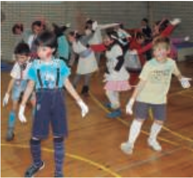
Eskularru zuriak, laxoa eta pajarita jantzi zituzten bigarren zikloko ikasleek.