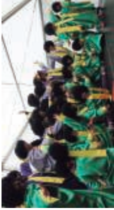
Gazte Borriako gorpel konparteean egokituz zate auzoerriaren begira irakurri eta okupatu borriaz.