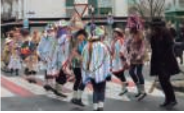
Dantzan pertsonala ezberdinak ikusteko aukera izan zen.