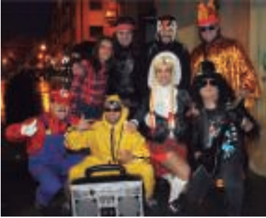
Gau partean gazte-koadrilak elkartu ziren parranda koxkorra bota asmoz.