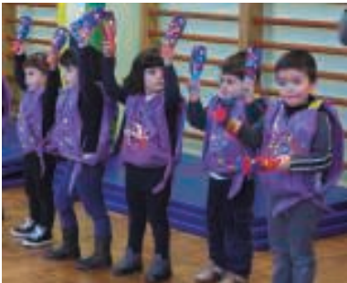
Zumaburuko haurrak Carlinhos Brownen doinuekin dantzatzten.