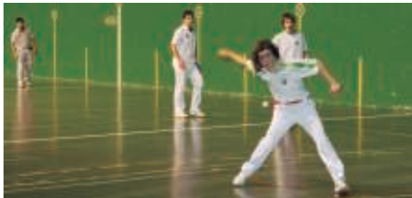
Hernaniko pilotariak Intzakoak baino hobekak izan ziren bai aurrean zein atzean azken emaitzak erakutsi bezala.

Senioren kasuan, Villabonako bikotea ez zen aurkeztu eta ondorioz partida galdutuz