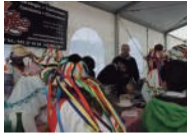
Hamaitetako egiteko aukera izan zen dantzan hasi baino lehen.

Hartza preso hartu eta plazaren erdian erre egin zuten aurpegia estalita zute txantxoek, hurrengo urtera arte.