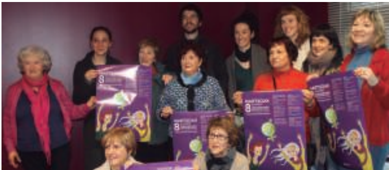
Emakumeen Zentroan ostiraletan aurkeztu zuten emakumearen nazioarteko egunagatik antolatutako egitaraua.

Bi antzezlan, ohiko elkarretaraztea, afaria eta abortuaren inguruko foroa dira ekintza nagusiak