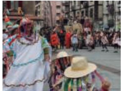
Okendon hasi eta plazan bukatu zen desfilea.