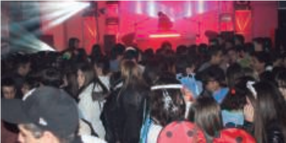
Abiba disko-jalok goizaldeko ordu txikitara arte luzatu zuen karpako festa.