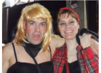
Rockabillyek ere primeran pasa dute aurtengo Inauterietan.