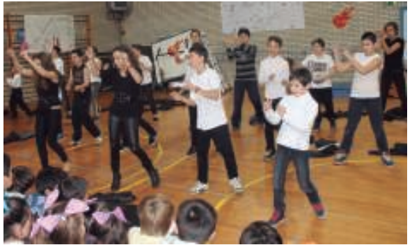
Olivia Newton John eta John Travoltaz josi zen Sasoetako gimnasioa.