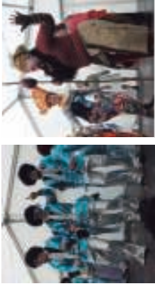
Habitak dabilo salatuaz eta soroen korongorak egiten zuzen, tartean herria. Daxok eta jalgonek.

TEXTUORIK G arte Borriako kompainiak legokitu zate auzoan, eta txupitoa prestatu zuten Okendo plaza eta inguruak. Erak izan dira Okendoko konparteei laguntza eman zutenak. Lehenak bildak den indarrez aurreran. Txorriak txori labaroen kamari ataratu. Hartz gain, hartz disko konpainiak zirkulo hamakatuak prestatu zituzten. Txupitoa sevilimila gonaz eta gitaraz Okendo plaza eta inguruak zeharrikatu zituzten. Elkar konparteei zela, hartz