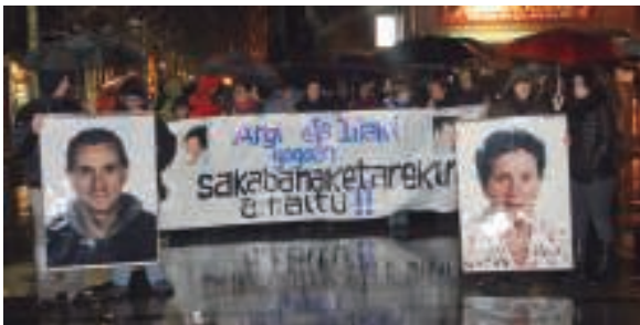
Ostiral arratsaldean dozenaka herritarrek manifestazio isila egin zuten herriko kaleetan barrena.

Lasarte-Orian bizi diren sahararrek eta taldeak hainbat herritarren babesa izan zuen ekimenean.