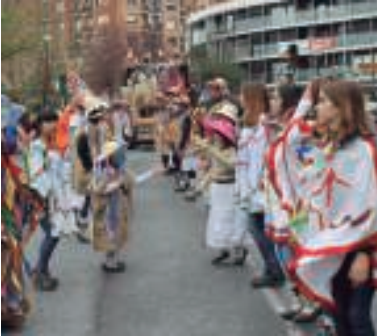
Adin ezberdinetako dantzariak atera ziren goizeko desfilean.