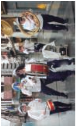
Larriaren kostak. Beldurik narrazioa oteatu zuten eta kalea bete baita zuzen larriarekin.