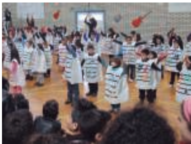
Sasoetako lehen zikloko ikasleak zintzo-zintzo euren koreografia egiten.