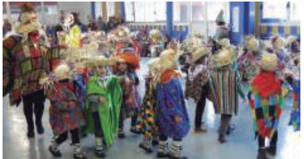
Urtero lez, txanbo jantzi koloretsuak eraman zituzten Garaikoetxeara.