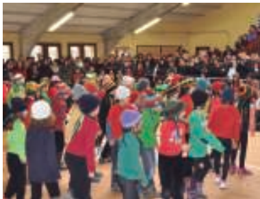
Bob Marleyren reggaea eta Jamaikako koloreak Landaberrin.