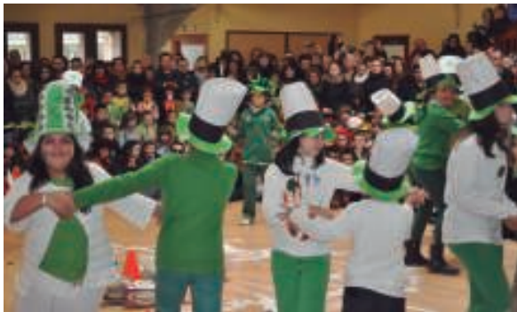
Landaberrin Irlandako musika zelta izan zuten, alaitasunez saltoka eta dantzan aritu ziren.