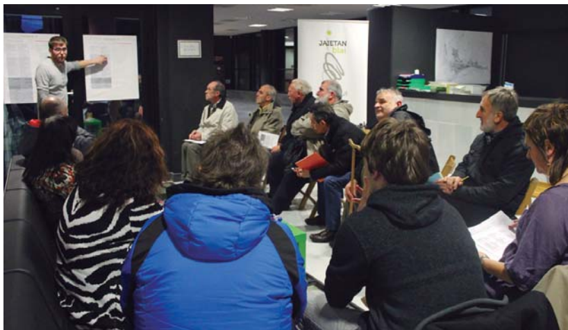
Jaietan Blai! prozesuko bigarren bilera egin zen asteartean. Bertan ekintza zehatzak proposatu zituzten herritar eta elkarteek.

Era honetara, proposamenak jasotzeko epea martxoaren 16ra bitartekoa izango dela gogorarazi du Gazteria eta Festak sailak.