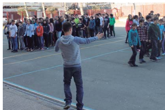
Ikasleek argibideak adi entzun zituzten.

Ikasleak multzoka antolatuta, euskararen erabileran portzentaia irudikatu zituzten. Ikasleek pozik egin zuten saioa langileek eskatzen ziz-