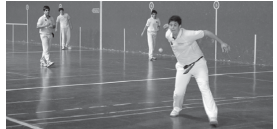
Kadeteek partida zaila izango dute. Hernani garaitu behar dute finalaurrekoan egoteko.

Asteburu garrantzitsua dute Intza-ko pilotariak. Udaberri txapelketako azken jardunaldia dute kadete, zein seniorrek eta jubentiek trinket txapelketako finalerdia jokatuko dute. Arteagak, berriz, Ogi-Berriko txapelketako partida du.