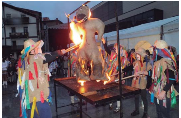
Iaz Munduko kulturek hartu zuten herria larunbatean eta igandean, Euskal Inauteriek. Eguraldi euritsuari aurre egin behar izan zioten iaz herritarrek.