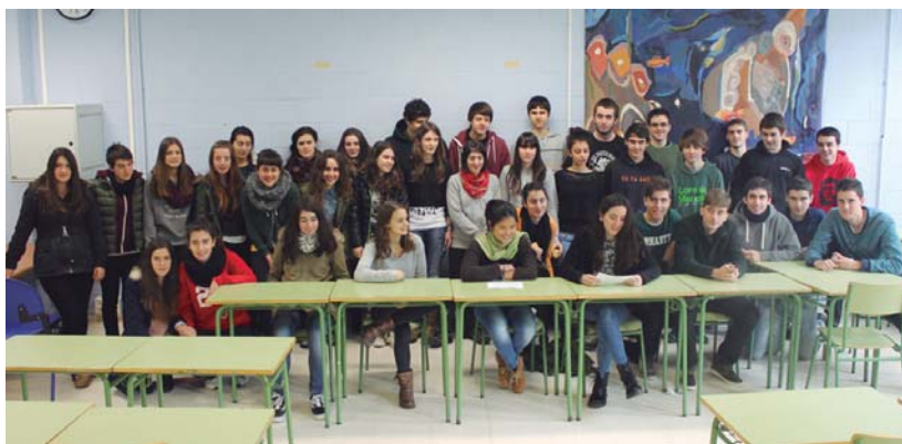
Lasarte-Usurbil Institutuko Ikasle Abertzaleak taldeak asteartean Institutuko hainbat ikasleren babesa izan zuen agerraldian.

Baina hau ez da ikasleek LOMCE eta gainontzeko erreformak gaitzesteko emango duten erantzun bakarra izan-