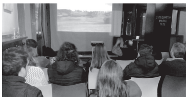
Patagonian barrera ibili ziren aurreko asteazkenean Jalgira hurbildu zuten herritarrek.

Honetan parte hartzeko haurrek izena eman behar dute Ttakun kultur elkartearen, 943 371 448 telefonora deituz edo asia@ttakun.com helbidera mezuaz bidaliz. Antolatzailerak antzerki digutenez, egunean bertan, haurrek 2 euro eta adingariak eraman beharko dituzte.