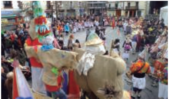
Plaza bete nahi dute Euskal Inauteri koloretuekin iaz egin bezala.

Mozorro koloretua Miel Otxinen antzekoa edo zakuz eginga Ziripoten antzekoa, edozerk balio du inauterietan. Soinean.- Blusa (sanpedro-