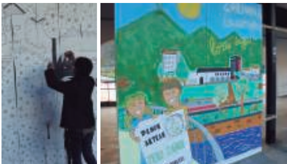
Hasierako mural grisari piezak kenduta, argazi koloretsua osatu zuten Zero Zabor taldeko kideek.