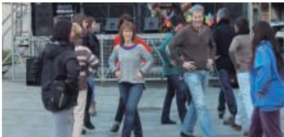
Sorgin-dantza herrikoa egin zuten Okendon hainbat lasarteotiarrek.

Egunari amaiera eman amoz, ilunabarrean Makulu Kenek kontzertua eskaini zuten Okendo plazako taulan, eritmo alaiak.