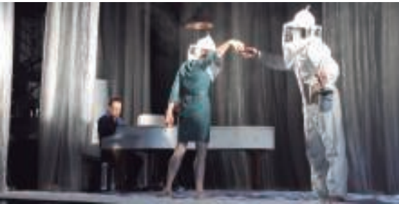
Mikel Laboaren bizitzako hainbat pasarte interpretatu zituzten Manuel Lekuonako oholtzan hiru musikari eta bi antzezlek.

Bestalde, Manuel Lekuonako eskenatokia argi-efektu sotilekin jantzi zuten. Berezi-keigarriak izan ziren eszenaz