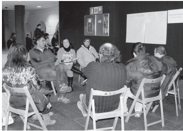
Jaietan Blai! 2014 prozesuko lehen bileran jaietako ezaugarriak finkatu ziren.

Lasarte-Oriako Udalak 2014. urteko San Pedro Jaia antolatzen ari da. Herritarren iradokizunak jasotzeko Jaietan Blai! ekimenari jarri du aurten ere martxa. Asteartean, otsailaren 25ean, 18:30etan ekimeneko bigarren saioa egingo da Udaletxe berriko harreran. Honetan elkarte eta herritarren proposamen zehatzak aztertuko dira.