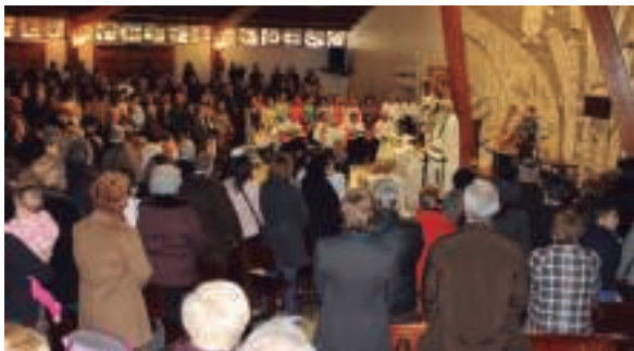
Asteburuko ekitaldi jendetsuena Arantzakoko Amaren parrokan ospatutako meza rozieroa izan da.