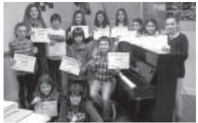
Andoingo Piano jaialdian izan ziren ikasleak lortutako domina eta diplomekin. LOME

Gainera, proposamen konkretuak aurrez pentsatu nahiez gero, herritarrek Lasarte-Oriako udaletxeako albistearen web orrialdean, albisteak.lasarte-oria.org , lehen bileran zehaztutako ezaugarriak zein diren jasotzen dituen dokumentua eskuragarri dutila azpimarratu du.