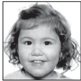
Aiara Zorionak printzesa zure bigarren urtebetetzean. Gurasoen eta izanen partetik.