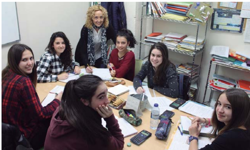
Urteurrena ikasleekin ere ospatu zuten asteazkenean baina ikasgeletan lanean jarraitu zuten.

"Hemengo irakasle on inplikazioa, ilusioa, gogoak mantentzen gaitu martxan 20 urteren ostean eta aurrerantzean, orain arte bezala lan egiten jarraitzeko asmo sendoa daukagu Meka Lekun".