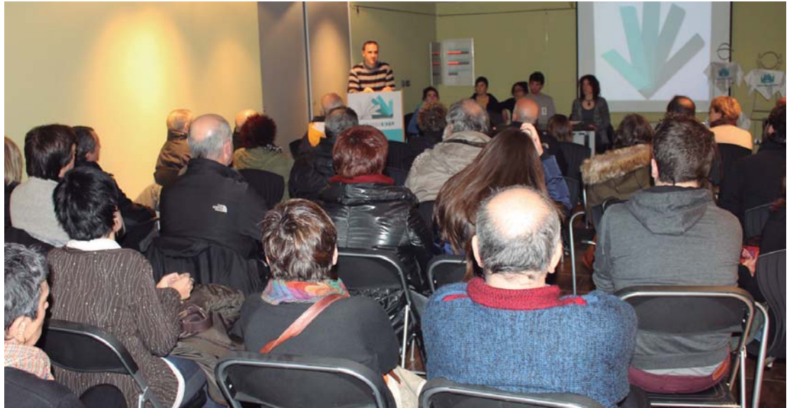
Lan taldeak Villa Mirentxun egin zuen ekimenaren aurkezpena herriko eragile ezberdinak gonbidatutako ekitaldian.

Lasarte-Oriako lan taldeak ekintzak antolatu ditu Okendo plazan