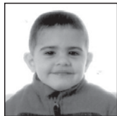
Hodei Zorionak txapelduna familiaren partetik. Gurasoen partetik bereziki!