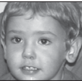
Hodei Zorionak amona eta familiaren partetik. Muxu handi bat.