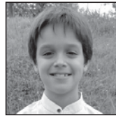
Nacho Zorionak familiaren eta bereziki gurasoen partetik. 9 muxu.