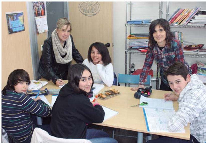
Irakasleak ikasleekin batera lanean.

"Lan talde finkoa izan gara ia hasieratik nahiz eta irakasle desberdinak ere pasa diren. Adibidez, egun dagoen laugarren irakaslea haurdu-