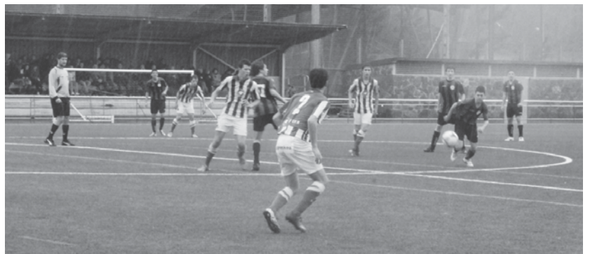
Eguraldi petrala izan zuten larunbat goizean Michelinen, haizea, hotza eta euri-zaparrada indartsuak.

Datorren astean beste talde historiko baten aurka jokatu du, Alavesen aurka