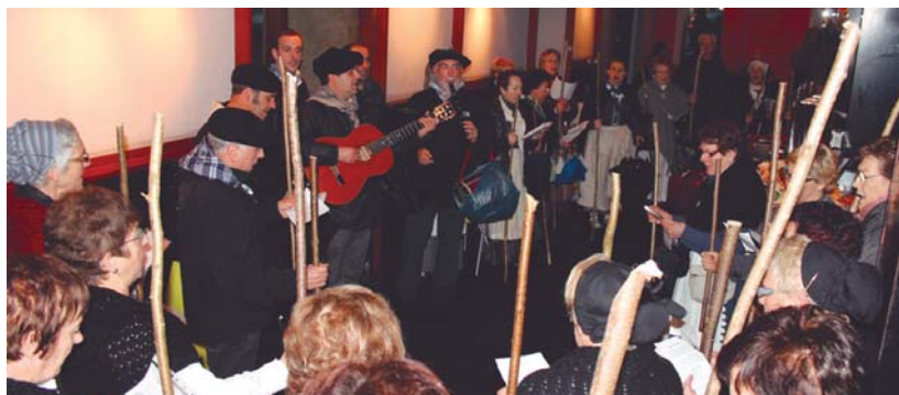
Bihar Santa Ageda bezperako erronda egingo dute hainbat taldek, besteak beste, Xumela korua eta Earra! bertso eskolako kideek.

Sasoeta-Zumaburu ikastetxeak zaharrenek goizean Zumaburuko txikiak abestuko diete eta arratsaldean, 16:30ean, gurasoek gozatu