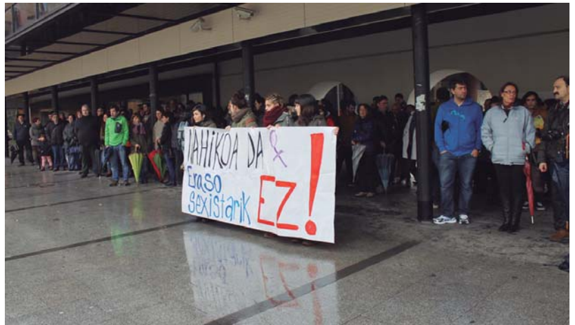
la 200 herritarrek egin zuten bat eraso salatzeko elkarretaratze deialdiarekin.

Ostiralean, bestalde, Lasarte-Oriako udala osatzen duten alderdiek agerraldia