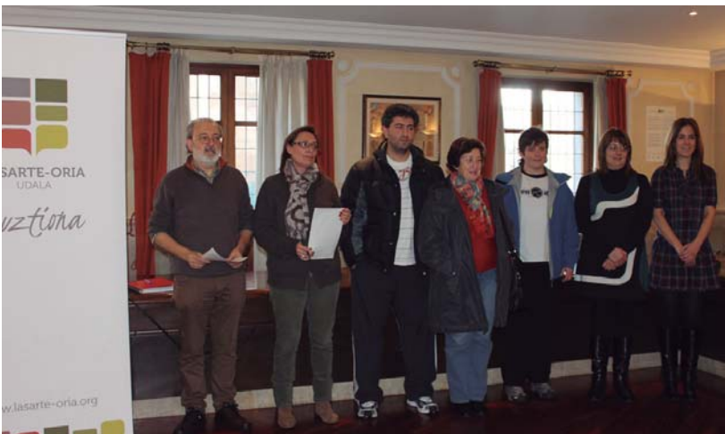
Udala osatzen duten alderdien ordezkariak agerraldia egin zuten eraso gaitzesteko adostutako adierazpena plazaratzeko.

Udalak larunbateko elkarretaratzean parte hartzeko deia luzatu zien herritarrei eta komunikabideei halako gaiek beharrezko duten ardurarekin jokatzeko eskatu. "Gertaturikoa larria ez ezik mingarria ere badenez, erasotak eta familiak merezi eta beharrezko duten intimitatea bermatzea exijitzen dugu".