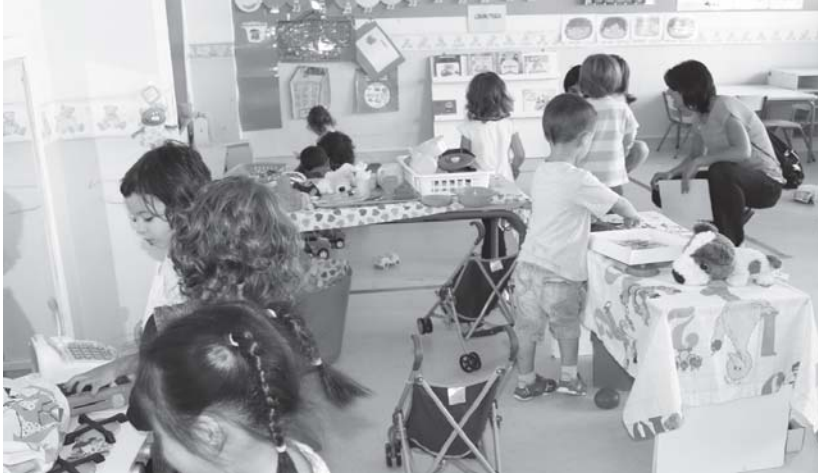
Zumaburur lehenengo eskola eguneko irudia, aurten 159 umerentzat izango da lehenengo ikasturtea.

Gaur zabaltzen da epea herriko eskoletan