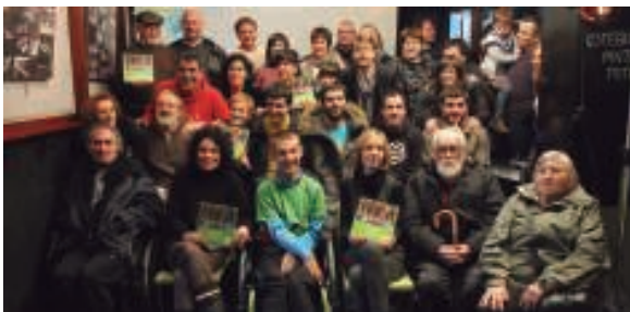
Aurkezpenari ekin aurretik talde argazkia atera zuten Pirritx, Porrotx eta Marimototsen lagunek.

Takolo, Pirritx eta Porrotx izatek Pirritx, Porrotx eta