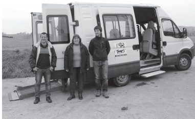
Bidez bide garraio zerbitzua landa eremuko herritarren onurarako izango da.

Lasarte-Oriako Udalak Behemendi elkartearekin elkarlanean Bidez Bide zerbitzua jarri du martxan. Baserrietan bizi diren pertsona adindu eta mugikortasun arazoak dituztenei zuzendutako zerbitzua da. Lasarte-Oriara jaiste ahalbideratuko die.