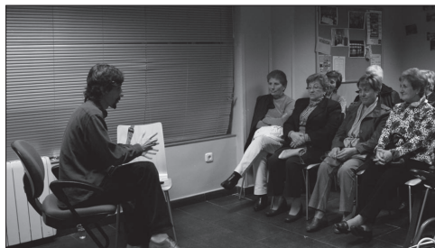
Herrian hainbatetan egin dira sexologiari buruzko hitzaldiak.

Sexua heziketa eskolako lehenengo urteetatik lantzea pentsa ezina zen duela hamarkada batzuk gurean. Eliza katolikoak heziketa sistema eduki zuen eragina dela eta ezzer gutxi jakituen zuten gazteek harreman, gaixotasun etabaren inguruan. HIESAK 80. hamarkadan izan zuen zabalkundearekin, gaia eskolotara eramaten hasi zen. Sexualitateaz mintzatzeari normaltasuna eman nahian, txikitatik heziketa sistema txertatu da nahiz eta oraindik egiteke asko dagoen adituaren arabera. Belaunaldi helduenentzat antolatzen diren hitzaldiak beharrezkoak dira oraindik.