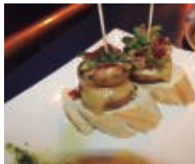
Jendetza bildu du I. Pintxo Lehiaketak, hamabi tabernatan saldu dira pintxoak, Arkupe (goi. / esk.) eta Buenetxean (esk.) kasu.