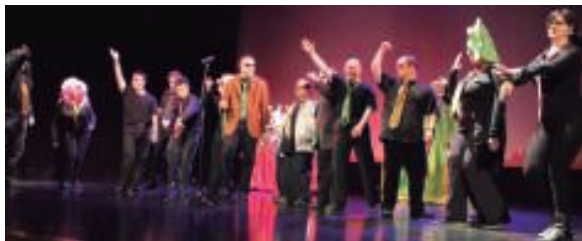
Primeran pasa zuten jalguneko lagunek herritarren aurrean kantatzu, dantzatu, musika joz... Zer nolako martxal!