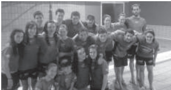
Errendimendu eta Partehartze Ligako bigarren jardunaldian parte hartu duten igerilariak.