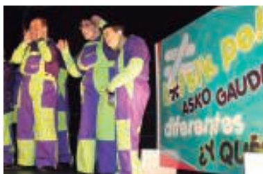
Jaialdiko argazki guztiak txintxarri.info atarian dauzkazue ikusgai.