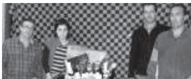
Ostadar SKT-ko arduradunak bazkideen artean zozketatuko den oinarriaren.

Oraindik bazkide ez diren herritarrei ere bazkide egiteko deia egiten die. Hauek edo