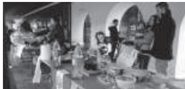
Nikaraguako produktuez gain, Peru eta Kolonbiako ere ikusgai ziren Okendon.

Asteburuko ekimenek harrera ona izan zuten herriko nikaraguarren artean, baina eguraldi txarrek festa zapuztu eta ezin izan zuten euren jaialdi kulturala nahiz bezala zabaldu. Hurrengo urtean izan beharko du.