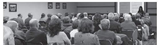
Herriko Gizarte Zerbitzuei buruzko hitzaldira herritar asko hurbildu ziren.

Ez zen egun honetan herrian egin zen ekimen bakarra. Institutuko gazte talde batek kamiseta morea jantzita argazki atera zuen. "Ikasleok ere generoen arteko indarkeriarekin bukatu nahi dugulako" azaldu zuten.