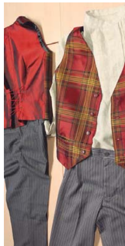
Euskal jantzi tradizionalen ikastaroa amaitu eta talde iraunkor bat sortuko da.