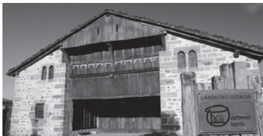
Olentzeroren etxea ezagutuko dute parte hartzen duten umeak.

Mungian, Bizkaian, kokatutako dago Izenaduba basoa eta honetara antolatzaileek azpimarratu moduan, joan ahal izango dira 2009, 2008, 2007 eta 2006an jaiotako haurrak. Goizeko 10:00etan aterako dira autobusean