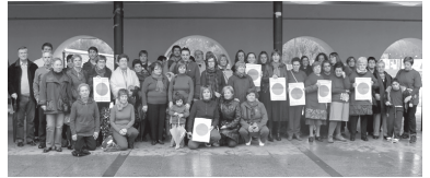
Gaur arratsaldean, kontzentrazioa izango da Okendo plazan.

Horretarako, ekimenak abiaraziko ditu, emakumeak, batez ere emakume gazteak, zaurgarritasunari aurre egiteko