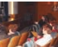
25+2 urteurrenaren gai giroa izan da nagusi. Behelko argazkia, Rebordinosen bisita.