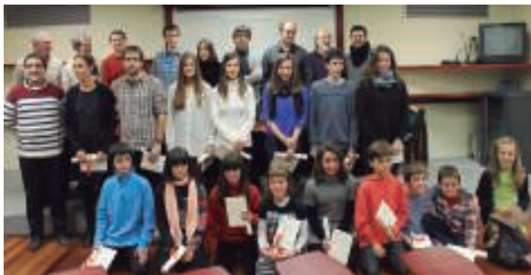
Sari-banaketa egin orduko, saridun guztiek familia-argazkia atera zuten.

Poza ere nabari zen bai idazle gaztetxo eta ez hain