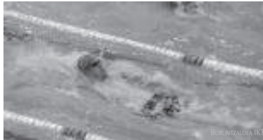
Buruntzaldea IKTko igerilariek lehen txapelketetan fin daudela erakutsi dute.

"Txapelketa saio gogor bat buru zutela azpimarratu du entrenatzaileak eta "denborarekin markak hobetzen ikusiko ditugula ziur gaude".