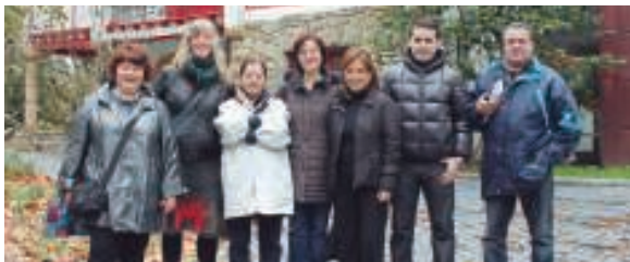
Pintxo lehiaketa parte hartuko duten hainbat tabernetako ordezkariak Villa Mirentan bildu ziren aurkezpena egiteko.

Aterpeko lehendakariak azaldu duenez, puntuaketa txartelak eskuragarri izango dira txapelketan parte hartzen duten tabernetan. "Txartelatan puntuaren argazkia eta izena egongo dira. Era berean, plano bat egongo da herritarrek parte hartzen duten tabernei kokalekua jakin dezaten".