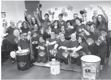
Jalguneko lagunek jaialdian eta batez ere, eltzekadan parte hartzeko gonbita egin zuten.

"Jaialdi gazi-goza izatea nahi dugu, Lasarte-Orian dauden zapore desberdinak nahastu daitezten. Gertaerak, iritziak eta gustuak elkarba-