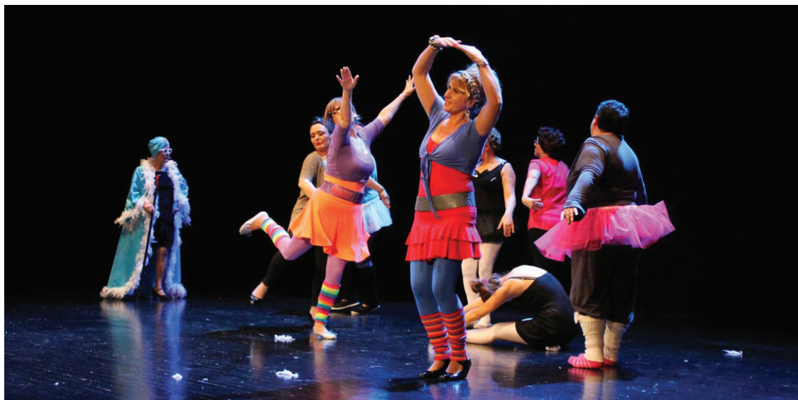
Emakumeen Zentro Zibikoko antzerki talde amateurrek "El cabaret de Madame" interpretatu zuen, umore onean.

Emakumeenganako Indarkeriaren Aurkako Nazioarteko eguna da azaroaren 25. Egun hori iritsi bitartean, bideoforuma, ipuin kontakizuna eta herri afaria prestatu dituzte.