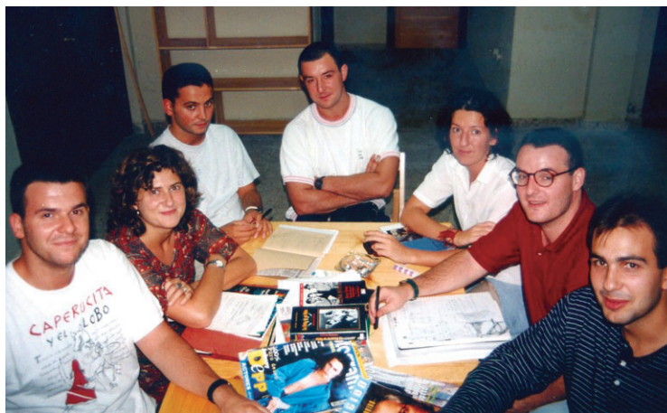
25+2 urte hauetan Okendo Zinema Taldea osatu duten lan taldeetako bat.

Baina funtsean taldeak berdin lan egiten zuela azpimarratu du, "eskema mantendu, film zerrenda bat aukeratu eta udalari jakin arazi".