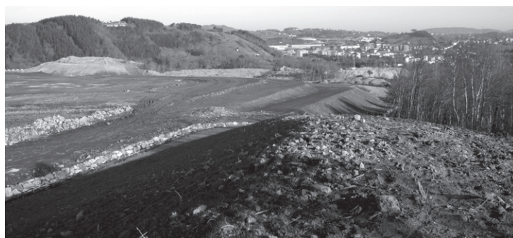
Uztailean GHK-k erraustegia plantaren lanak etetea erabaki zuen.

Prensaurrekoan aipatu zuten bezala, Gipuzkoako Hondakinen Kontsartzioak UTE