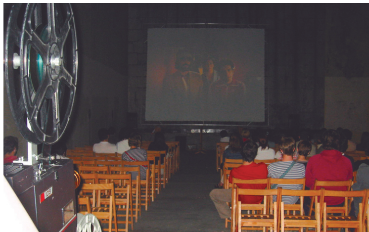
Tedoso zinema, Manuel Lekuonan edo Okendoko pilotalekuan eskaini dituzte filmak.

Azkenik, urteurren hau ospatzeko kamisetak salgai jarriko dituztela ere aurreratu dute "Okendo zinema taldeko kamisetek arrakasta izan zuten bere garaian eta aurten ere kamiseta berezi batzuk egingo ditugu".