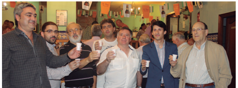
Semblante Andaluzeko lehendakaria, udal ordezkari eta elkarteko lagunak ohorezko ardoarekin topa eginen.

Igandean ere askotariko ekitaldiak prestatu ditu Semblante Andaluz elkarteak.