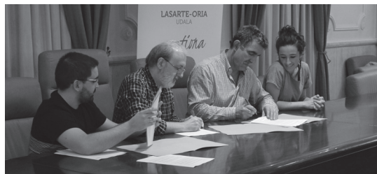
Kukuka antzerki eta dantza eskolako eta Udal ordezkariak hitzarmena sinatzen.