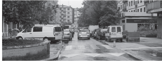
Esate baterako, Uistin kaleko aparkalekuak aipatu ziren aparkalekuen gaia jorratzean.

Asteartean urriko ohiko batzarra izan zen. Bertan aurkeztutako mozio guztiak onartu ziren, hala nola, abereen jabetzaren araudia berria, 2014 urteko taxien tarifak edo aparkaleku gehiago sortzeko azterketa.