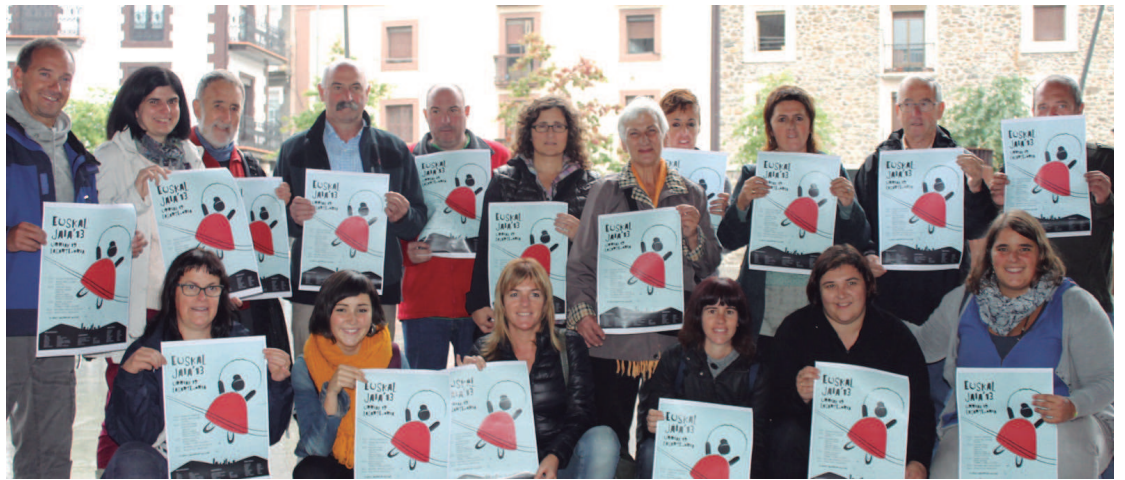
Euskal Jaian parte hartuko duten elkarte eta talde batzuetako ordezkariak izan ziren atzo arratsaldean Okendo plazan egindako aurkezpenean.

Asteartean Udalbatzarra ospatu zen eta gai guztiak onartu ziren. Gai nagusia PSE-EEK aurkeztutako eskaera izan zen, aparkalekuen arazoa konpontzeko trafikoaren eta kaleetako aparkalekuen azterketa egitea. Abereen jabetza eta osasuna babesten duen araudia eta 2014 urteko taxien tarifak ere aztertu zituzten alderdiek. Bestalde, Bilduk PSE-EE eta PPri aurreko batzarrean Udal inkestaren inguruan gezurra esan izana aurpegiatu zien.