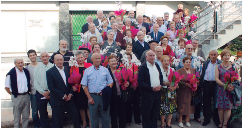
Aurten Lasarte-Oriako 26 bikotek ospatuko dituzte urrezko ezteiak herrian. Guztiek izan zituzten opariak.