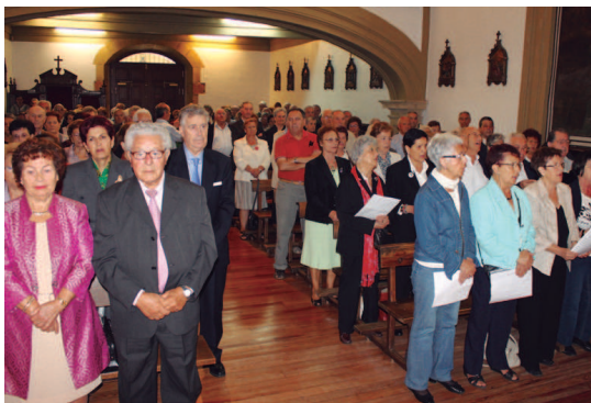
Elkartetik Ama Brigitarren komentura kalejira, meza eta luncha izan ziren asteartean.