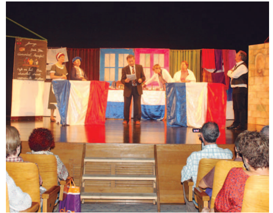
ONCEko antzerki taldeak "Clochemerle" lana eskaini zuen astelehenean.