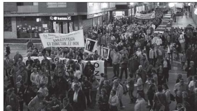
2006an manifestazio jendetsua egin zen herriko kaleetan errauskailuaren kontra azaltzeko.