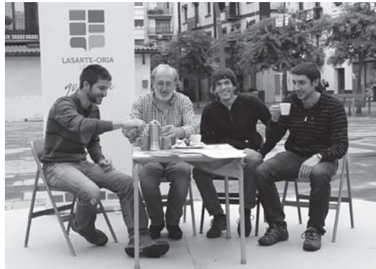
Udal ordezkariak eta Aztikerreko teknikariak aurkezpenean.

Lasarte-Oriako Udalak Aztiker enpresaren laguntzaz "Anitzen sarea" jarri du martxan. Proiektu honen bitartez Lasarte-Oriako kultur aniztasuna landu eta aztertu nahi du Udalak. Honen barruan, ostiralean Worldkafe ekimena egingo da Okendo Plazan eta abenduan, Aniztasunaren astea.