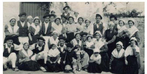
Biyak Bateko kideak baserriarrez jantzita Zubietako Euskal Jaian.

1950. hamarkadako hainbat dantzari irudi Euskal Jaia titulupean izendatzen dira baina ezin daiteke zehaztu benetan Euskal Jaia