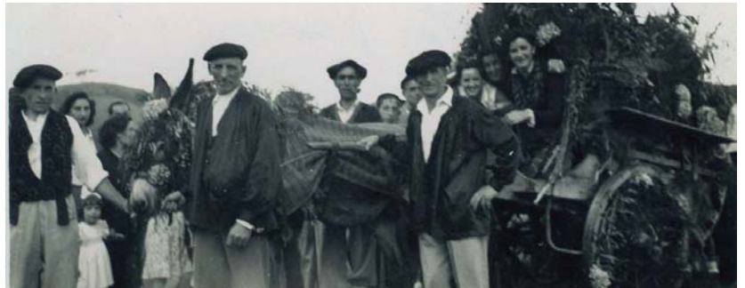
Lasarteko Euskal Jaia ondoren Michelin fabrika egin zen zelaian ospatu zen, bertan Euskal Ezkontza anteztatu zuten.

Euskal Pizkundera edo ondoren lehenengo Pizkundera bezala ezagutu dena, euskal literaturak bizi zuen garai emankorri deitu zaio, garai hau XIX. mendeko bigarren erdialdetik XX. mendeko