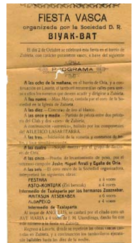
Biyak Batek 1927. urtean antolatutako Euskal Jaiko egitaraua.

Herritar batzuk aipatzen dutenez karroza ederrak ikusten ziren egun horretan eta lasartearekin ohitura zuten festa baserriarrez jantzia joate, batez ere haur eta gaztetxoak. Hala ere, Euskal festa baino, udaberriko edo udako festa izenez ezagutzen zirela gogoan dute.