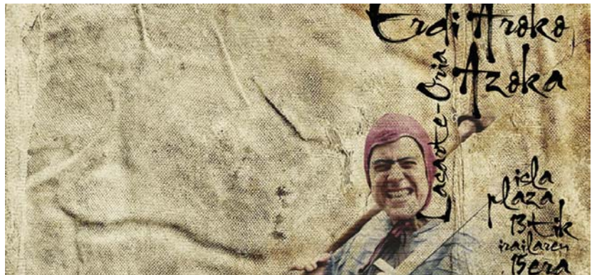
Erdi Aroko Azoka gaur hasiko da 18:30etatik aurrera.

Ondoren, Eskekoak, 20:00etan Gurutzadetara, 20:45ean Agoteren eta Damaren amodio ezinezkoak eta 21:30ean Aitaren bulda kale ikuskizunekin gozatzeko aukera izango da.