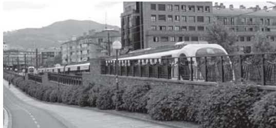
Trenak sortzen duten soinuaren aurkako neurriak eskatzea adostu zen Udaltzarrean.

Ohiko Udaltzarrak izan zen astearte arratsaldean. Honetan 2013 urteko aurrekontuen dosiera guztiz onartu zen. Era berean, Eusko Jaurlaritza eta Euskotren-i trenak sortzen duen soinua murrizteko neurriak har ditzan eskatuko die Udalak.