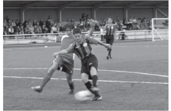
Lasarteoriatar ugari hurbildu zen Kirol gunera Euskal Ligako partida ikustera.

Lasarte-Oriako futbol taldeek 2013-1014 denboraldiari hasiera emango diote pixkarena. Ostadarreko Euskal Ligako kadeteek lehenengo astean izan zuten lehen partida Loiola Indautxuren aurka eta garaipena 6-2 lortu zuten. Ohorezko Mailako erregionalak, berriz, aste honetan du lehen jardunaldia Zarautzen aurka.