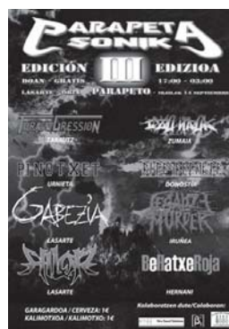
Jaialdiko kartela eta taldeak.

Antolatzaileek aurreratu dutenez, gainera, herriko "Gabezia" taldeak bere maketa aurkeztuko du jaialdian. Eta edariak prezio ezinhobean izango direla ere aipatu dute, "kalimotxo eta garagardoa euro batean".