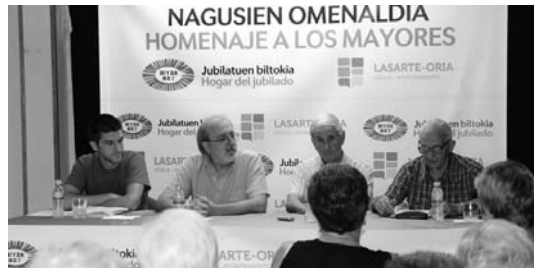
Udaletxeko eta jubilatuen biltokiko ordezkariak asteazkeneko agerraldi jendetsuan.

Gaur hasiko da ekintza guztietan izena emateko epea. Aurtengoan lehenengoz aste berezi honi hasiera emateko txupinazoa botako dute jubilatuen biltokitik. Antolatzaileek bertako bazkide ez direnen parte hartze handiagoa lortu nahi dute.