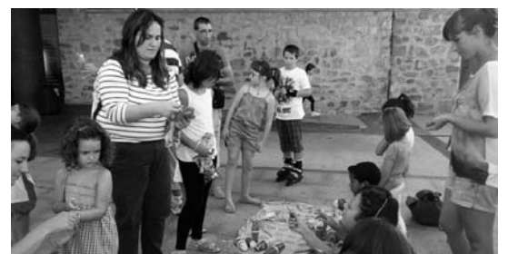
Soiane baserrira egindako bisita goian eta behean "artisau azoka" berezia.