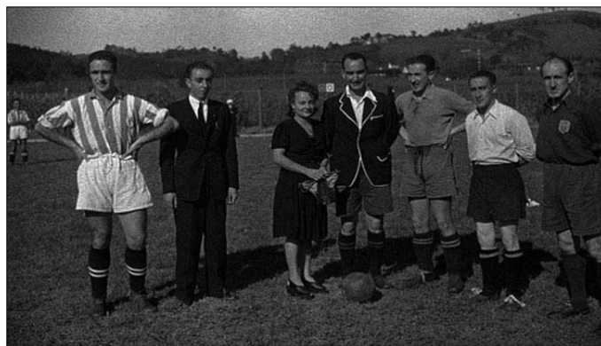
1945. urtean inauguratu zuten realeko taldeek Michelingo zelai zaharra.

Lasarte eta Oriako taldeak batzuek asmoz sortu zen herriko lehen futbol taldea 1923. urtean "Biyak Bat". Honek 200 bazkide zituen hasieran eta bakoitzak 1peztako kuota ordaintzen zuen. Zaletasuna orduaroko handia zen herrian, 1945ean inauguratu zuten Michelin enpresak zelai dotorea eta egun horretan Realeko jokalariek egin zuten erakustaldia. Ordurarte hipodromoko zelaian jokatzen zuten herriko taldeek eta ondoren Michelingo zelaia kokatu zen Arkaiztan. Futbol talde asko izan dira urteetan herrian sortutakoak eta kirol honekiko zaletasuna ere honen mailakoa izan da.