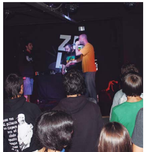
Ezkerrean Bordeleko Guaka taldea eta goian SUA Fest jaialdiko “rap guda” bat.

Ikasturtea amaitu bezala hasi du Zulo aretoak, hau da, ekintzaz ekintza ia arnasarik hartu gabe. Ostiralean Maputxeek bizi duten egoera zaila herritarrei hurbildu asmoz hitzaldia eta Bordeletik gurera etorri den Guaka taldea izan dira. Hegoamerikako gizatalde honek Espainiaren konkistaz geroztik bizi duten egoera salatzen asmoa zuten bi ekintzek eta bai kontzertuan eta bai hitzaldian jende andana gerturatu zen. Larunbatean berriz, Sua Fest jaialdia eta txapelketa arteko nahasketa egin zen, genero indarkeria eta arrazakeria salatu asmoz abestu zuten partaideek erritmoz erritmo eta errimaz errima. Honen ostean, Bartzelonatik etorritako URS & Dj ASYLUM-en emanaldia eta gipuzkoar DJ talde baten emanaldia izan ziren entzungai ordu txikietara arte.