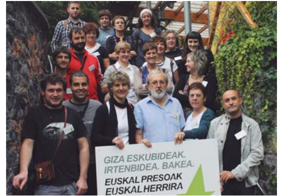
Alkate eta zinegotziak Villa Mirentxun egindako agerraldian.

Herriko presoekin bisita erronda ofizialari egingo diote udal ordezkariak; Herriko presoek udal erabakiak eta udalak argitaratu edo ateratu