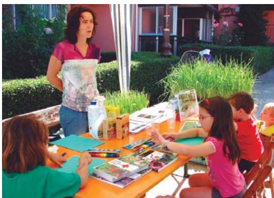
Baratza tailerrera hainbat gaztetxo hurbildu ziren iaz. Aurtun Atsotabarren izango da.