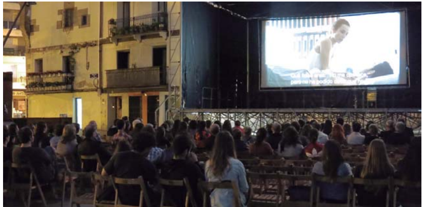
Ostegunean, hainbat herritarrek gau giro ederraz eta "Bypass" filmaz gozatu zuten Okendo plazan.

Kultur kale Zikloko udako kontzertuak ere izango dira.