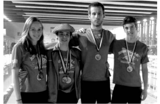
Buruntzaldea IKT-ko igerilarien San Martzial proba ondoren. BURUNTZALDEA IKT

egin zuten. "Nahiz eta baja garrantzitsuak izan," neskek 5 errelebuetan markak hobetu zituzten.