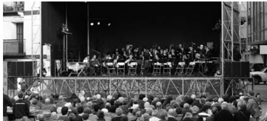
Aurreko kontzertua Okendo plazan egin zuten abesbatzak.