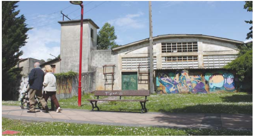
Elebeltz, Sorkuntza eta Eztabaida Askerako Topagunea: Industrialde zaharreko eraikinean biltzen dira astelehen iluntzetan.

Okupazioak aspalditik izan du lekua Lasarte-Orian. Adibide asko dira, INEM eta Udaletxe zaharrak, Villa Mirentxu, Andre Joakinaena... Horrek, gainera, batzuei