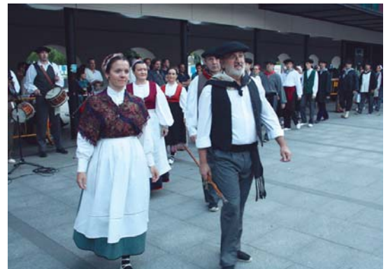
Iaz bezala, Lasarte-Oriako alkate eta hainbat zinegotzik soka-dantzan parte hartuko dute.

Eta hau amaitzean, 22:00ak aldera, denek espero duten