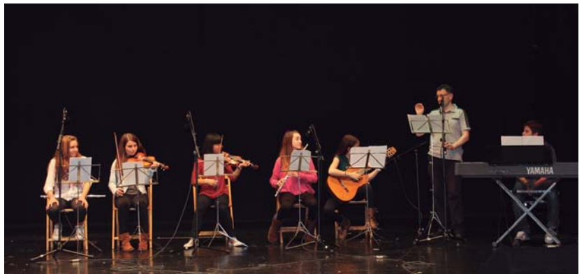
Musika eskolako ikasleek irakasleen laguntza izan zuten emanaldian. Diploma banaketa musikarekin lagundu zuten ere.