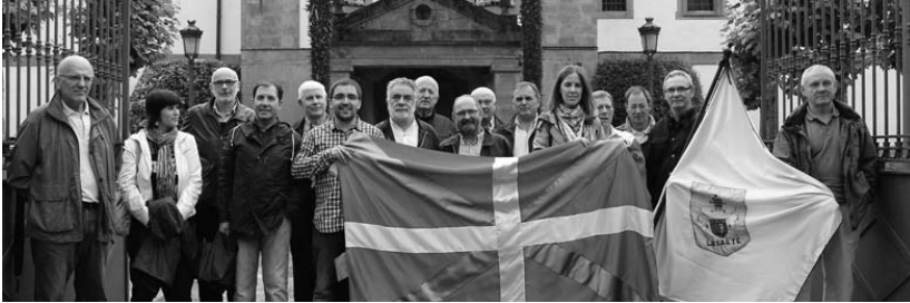
Brigitarren komentuan egin zuten aurkezpena asteazkenean BAI taldeko kideek.

BAI, Bakea, Askatasuna eta Ikurrina da taldearen izena