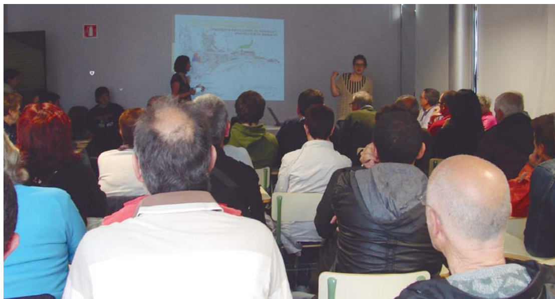
Lasarte-Oriako Udalak egindako deialdiari erantzunez, hainbat izan ziren parte hartze bilerara hurbildu ziren herritarrek.