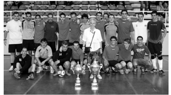
El Punto de encuentro taberna eta ISU Leihoak izan ziren iazko kopako finalean.

Areto-futboleko zale-tuek asteburu honetan hitzordu garrantzitsua dute kirol gunean, Mosso oroimenezkoa. Aurten edizioak berrikuntza handia dakar, asteburu batean jokatuko dira partida guztiak. Beraz, igande eguerdian jakingo da zein taldek lortu duen kopa.