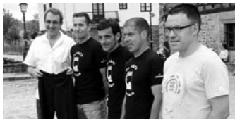
Korrikalariak babesleekin egin zuten agerraldia.

Geroz eta ospe gehiago hartzen ari dira mendi-lasterketa gogorak. Baina Aralar eta Aizkorriko mendizerrak zeharkatzen dituen Goierriko 2