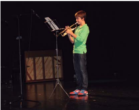
Taldeka zein banaka aritu ziren lehenengo emanaldian musika ikasleak.