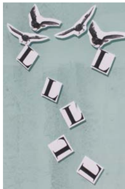
Bele beltzak ageri dira kaleetan.

bertan bizi eta alokairurik ez ordaintzea ahalbideratzen die. "Lekua badago", diote.