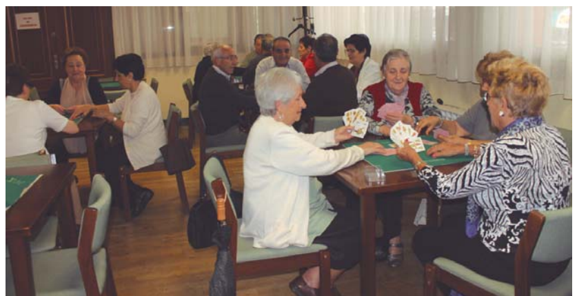
Hainbat izan dira aste hauetan mahai-jokoan inguruan Biyak Bat elkartean bildu diren herritarrak.

Antolatzaileek jakitera eman dutenez, ekainaren 27an, osteguna izango da txapelketa guztien sari banaketa eta horregatik irabazleak eta finalistak gonbidatzen dituzte ekitaldira.