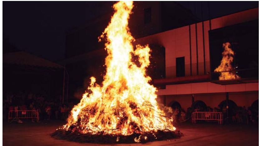
Igandean, San Juan sua izango da Okendo plazan. Herritarrek urtean zeharreko oroitzapen txarrak erretzeko aukera izango dute.

Honela igandean, San Joan bezperako ospakizunak izan-