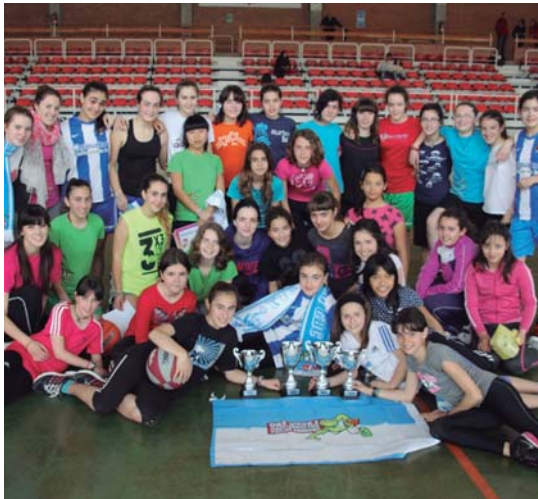
Saskibaloiko neska, pozarren, aurten lortutako garaipenekin.