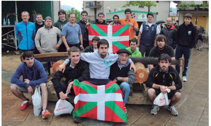
Proba mixtako argazkia eta denborak: Telleri Gaina 11'43", Auzoko Gazteak 11'43,2", Zubieta 12'36", Zabaleta 12'54".