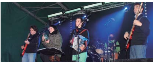
Xumela abesbatzak, buruhandiek eta herriko musika taldeek ere girotu zuten festa.