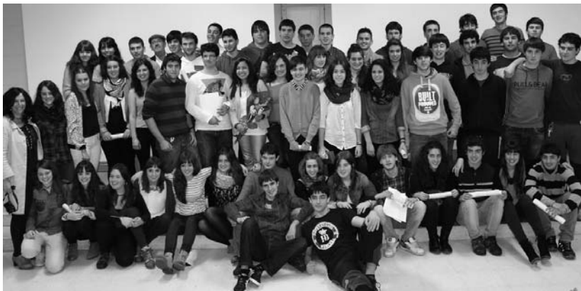
Ikasle eta irakasleek familia argazkia atera nahi izan dute ekitaldia bukatzerakoan.

Zortzi ikaslek matrikula eta aipamen berezia eskuratu dituzte