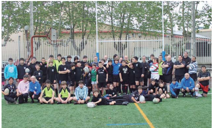
Beltzak Ostadar Jalaik denboraldia bukatu du. Igandean guraso eta seme-alaben arteko partida jokatu zen, ostean, Udaberrin lunch-a.