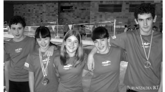
Kirol Jokoetan parte hartu zuten igerilariak lortu zituzten dominekin.

Buruntzaldea IKT-ko bigarren urteko alebinak Durangon, maiatzaren 25ean, jokatu ziren Euskadiko Eskolarteko Kirol Jokoetan parte hartu zuten. Igeriketa taldeko gazteek lan ederra burutu zuten eta gehienek haien marka hobetu zuten.