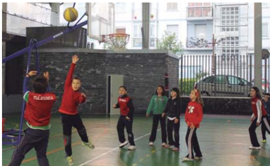
Besteak beste, atletismoan eta saskibaloian aritzeko aukera eduki zuten gaztetxoek.