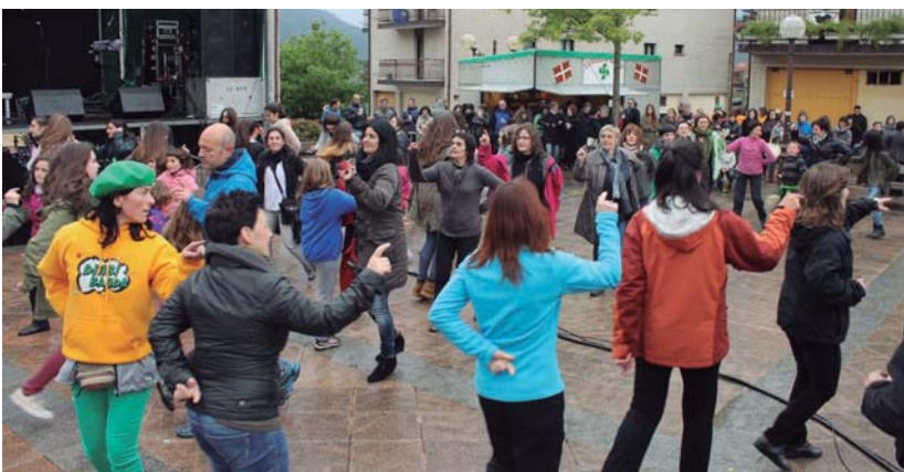
Oriako Sorgin Dantza herrikoia egin zuten Zabaletako festetan, haur, gazte eta heldu herriko antzinako tradizioei eutsiz.

Argazki galeria eta bideoak txintxarri.info webgunean