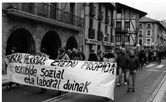
Greba orokorraren alde egin zuten gazteek eraman zuten pankarta.

Hezkuntzan herriko eskoletan jarraipen ia erabatekoa izan zuen grebak eta udalean adibidez zerbitzu minimoak bete ziren. Michelinen berriz, "jarraipen eskasa" izan zuten lanuzteak enpresa batzordeak grebara ez deitzea erabaki zuelako besteak beste.