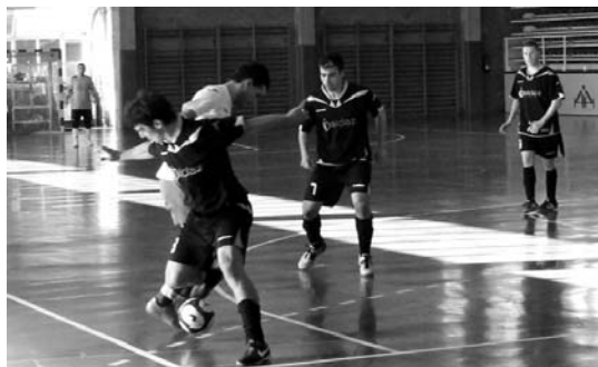
Aldaz H.K. taldeak hamaikagarren postuan amaitu nahi du denboraldia asteazkenean.

Hala ere, pozik agertzen da taldeak egindako lana eta izan duen portaerarekin. "Azken partidari ongi ibili gara 9 puntutatik 7 lortu ditugu", azpimarratu du. Esate