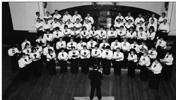
1989. urtean San Pedro elizan eskainitako kontzertuan Albokako kideak. Alboka