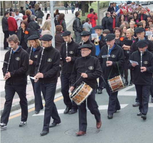
Kalejira andoingo Olagain txistularien eskutik herriko kaleetan barrena.