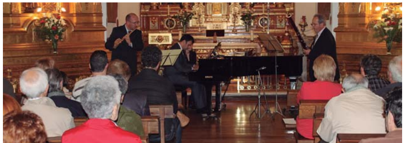
Danak Kidek eta Udalak antolatuta, Fabordon Hirukoteak kontzertua eskaini zuten Brigitarren komentuan, 50 bat lagunen aurrean.