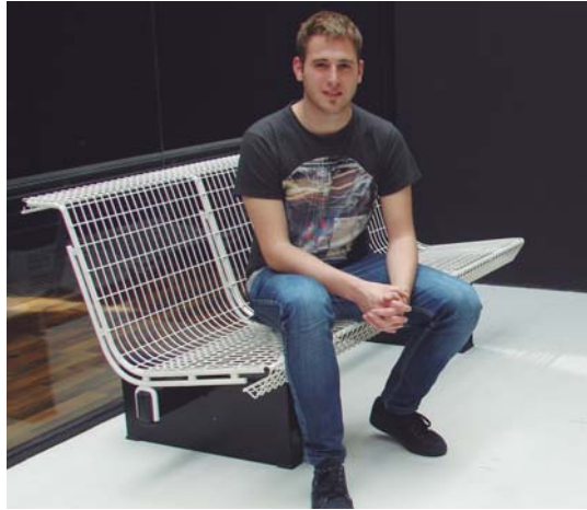
Taxio Arrizabalagaren erroka Gaztelekuaren erabileran dago.

Gure kezka nagusia hau zen, Gazteriarentzako eraikina da baina guztiak hemen lekua edukitzeko nola antolatu? 12-17 urte bitartekoentzat nerabe zerbitzua garatu dugu eta 17-30 urte bitartekoentzat beste planteamendu bat eduki behar duela ikusi eta espazioen erabilerari eta programazioa, edo eskaintzari lotuta.