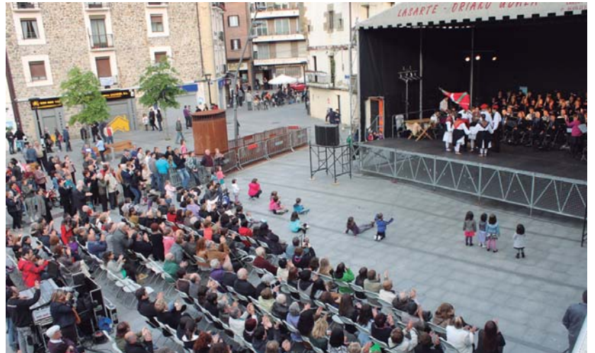
Itxura zoragarria zuen Okendok Udalexe berriko balkoitik ikusita, plaza jendez gainezka Alboka Abesbatzaren kontzertua entzuteko.