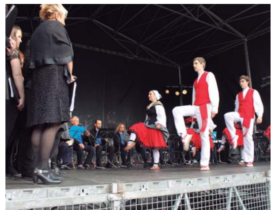
Erketz Dantza Taldekoek agurra dantzatu zieten Albokako partaideei.