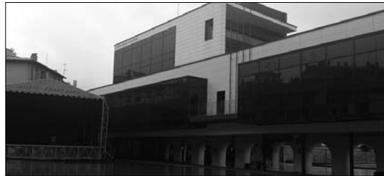
Udaletxe oraindik ez dago udalaren esku eta horrek arazoak sortzen ditu.

EAJ-ren eskaerei dagokionez, Udal gobernuaren esku-ra dauden baliabide guztiak jartzen direla arazo hauei