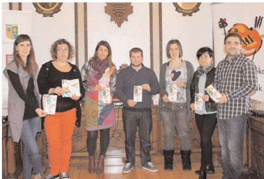
Andoainean egin zuten aurkezpena udal eta auto eskoletako ordezkariak.

Lasarte-Orian hiru dira egitasmo honetan parte hartzen duten auto eskolak eta horrela izanda, hiru sari banatuko dira euskaraz gidabaimenaren atal teorikoa ateratzen duten herritarren artean. Zozketan parte hartuko dute eskualdean erroldatuta eta teorikoa urtea amaitu arte gainditzen duten herritarrek.