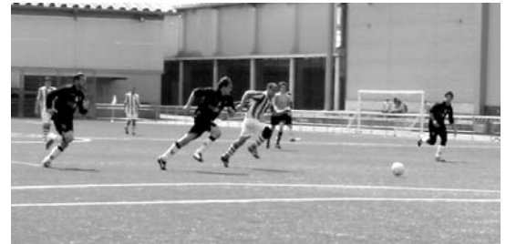
Texas-Lasartearra-ko erregionalak ederki saiatu ziren igandean bigarren postua mantentzeko.