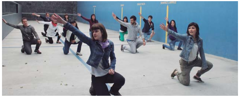
Astelehenean eta asteazkenean egin dira larunbaterako dantza ikasteko entseguak trinketeen.