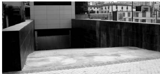
Okendoko garajeak ez dira iraindik Udalarenak eta prozesua atzeratzen ari da.

Duela urte eta erdi Lasarte-Oriako garajeen eskaera jakiteko izena ematea egin zuen Udalak eta geroztik, herritarrek eskainitako garajeen esleipenari buruz galdetzen dute. Lasarte-Oriako EAJ-k asteartean herritarren galderei erantzun eta Okendoko garajeen buruz duen bere kezka azaldu du, Michelingo garajeen arazoak errepikatzea.