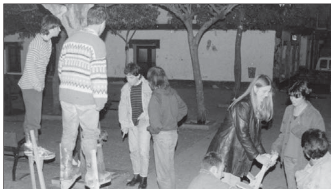
1993ko azaroan Gazte Astearen trikimaki ikastaroa egiten.