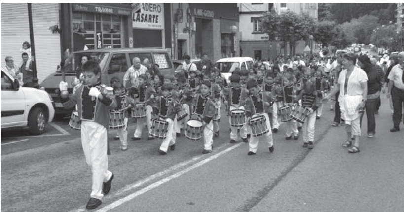
Haur eta gaztekoen danborrada ekainaren 30ean, igande goizean aterako da San Pedro jaietan kaleak alaitzeko asmoz.