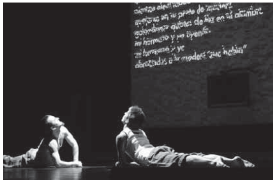
Kukai dantza taldeak "Otehitzari biraka" lana eskaini zuen iaz Manuel Lekuona.

Lasarte-Oriako Kultura sailak Eusko Jaurilaritzaren laguntzaz, Lasarte-Oria dantzan antolatu du berriro ere. Aurten hiru hitzordu izango dira dantza garaikideaz gozatzeko. Lehengoa larunbata honetan izango da, Dantza konpainiaren "Ar-tean" ikuskizuna.