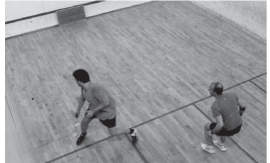
Aste osoan zehar, txapelketako lehen jardunaldiko partidak izan ziren kiroldegian.

XXV. Squash txapelketa hasi zen lehenengo astean. Aurten 15 jokalarari dira garaikurra lortzeko lehiatzen ari direnak. Txapelketak hiru fase desberdin izango ditu eta txapeladunen fasetik aterako da aurtengo irabazlea.