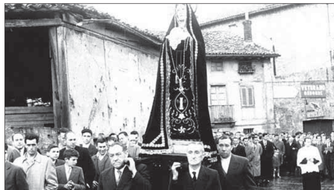
Tomas Fernandezek bildumako argazkian, herrian egiten zen Aste Santuko prozesioa 1958. urtean.

Oporrekin lotzen ditu jende askok egun Aste Santuko jai egunak baina fededunentzat bestelako esanahia dute. Herrian garai batean, inguruko gehienetan egin bezala, prozesioa burutzen zen ostiral santu egunean. San Pedro elizatik Kristo Etzanaren irudia prozesioan ateratzen zuten herritarrek eta irudiari lagunduta elizgizona gain, herriko beste agintariek ere parte hartzen zuten. Kristo Etzanaren atzetik Ama Birgina ere eramaten zuten Goiko kalerantz. Emakume eta gizonek jantzi beltzak janzen zituzten hain egun berezian dolua erakusteko moduan.