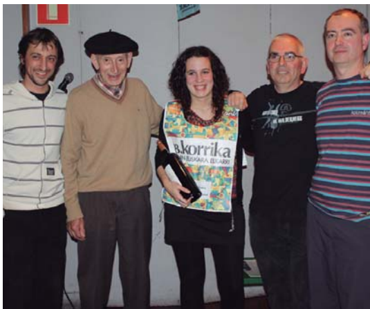
Lasarte-Oriako bertso txapelketako parte-hartzaileak, Labaka txapelketa erdian.