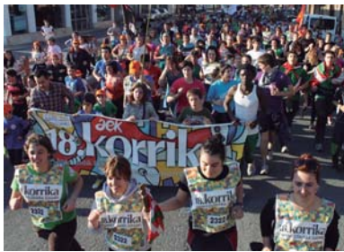
Herriko ikastetxeek Oriara eraman zuten lekukoa, jendetza atzean hartuta.