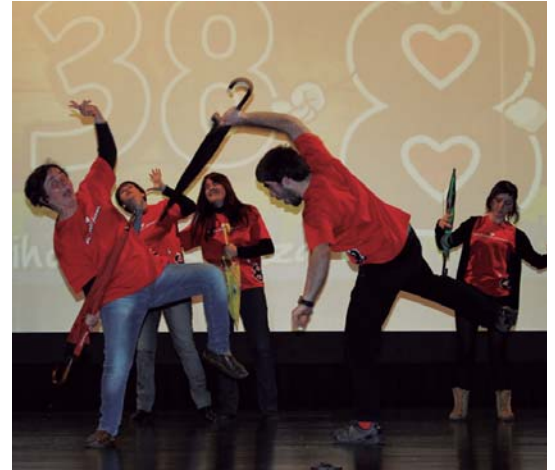
8. Maratoiko bideoaren aurkezpena egin zen ostiralean, zortzikotearen laguntzaz.