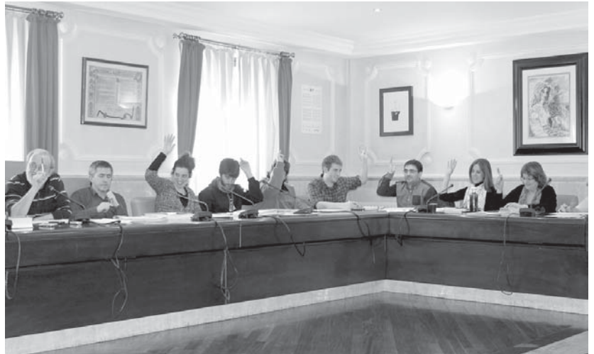
Bildu, EAJ eta Lasarte-Oriako Herritarren Plataformako ordezkariak bozkatu zuten 2013ko aurrekontuen alde.

Alkortak jakinarazi zuenez, Udal zerbitzurik ez kentzea, baliabideak optimizatzea, Kultura, Euskara, Gaztedia eta Kirol sailetan inbertitzea eta bereziki Gizarte Zerbitzuean arreta jartzea izan dira helburuak.