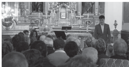
Herritar ugari bildu zen Errezitaldi lirikoaren entzuteran.

Guridi eta Antonio Mercero herritarren doinuek eman zioten hasiera emanaldiari. Jarraian kantu ikasleek bakarka, bikoteka zein taldean opera eta obra handietako doinuak besteak beste, Haendel-en "Mesias", Bach-en Si minorreko meza edo "La Leyenda del beso" zarzuelako duoa.