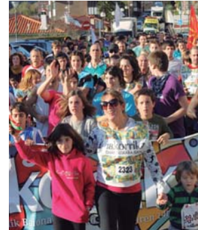
TSST Autobusek lau gurgilak aparkatu eta Korrika aritu ziren!

Festa handia izan zen Korrika 18 eta Okendon nabaria izan zen arratsalde osoan zehar erromeriak alaituta.