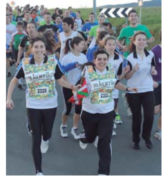
Ostadar SKT-koneskek sasoiari daudela erakutsi zuten aldapa gora!