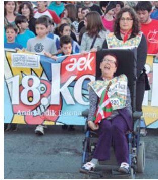
Zabaleta auzoko lekukoa Alfonsiti eraman zuten!