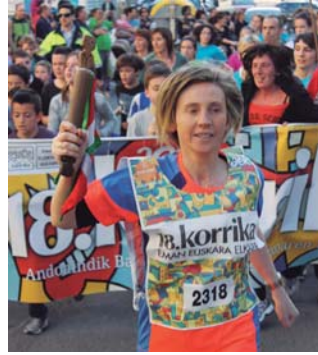
Arrate Oianguren korrika, Ttakin Kultur Elkartearen kilometroan.