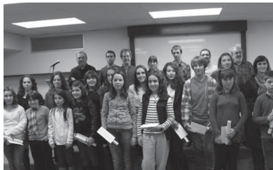
Iaz sarituak izan ziren parte hartzaileak udal ordezkariekin batera.

Lehiaketan parte hartzeko oinarriak eta sariak