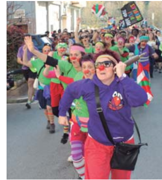
Kukukak lagunek mozerrotuta egin zuten korrika! Hori kolore festa!