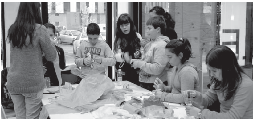
Gaztelekuko instalazioak ikusteaz gain, gazteek malabare tailerra izan zuten. Honetan kariokak egin zituzten.