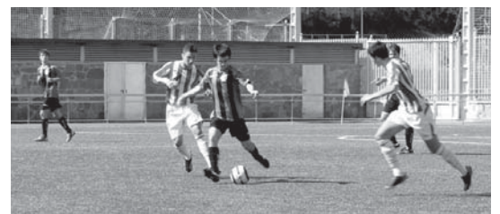
Ostadar eta Athletic-en arteko norgehiagoka polita ikusi ahal izan zen kirol gunean.