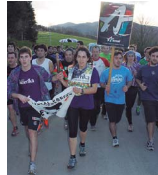
Sorgin Jaik eta Emari Kaxkarro gainean, lekukoa Urnietan utzi aurretik.