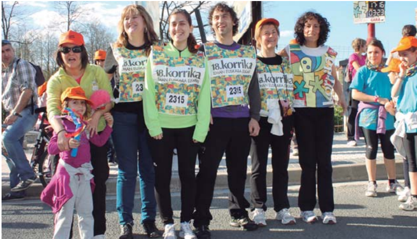
Korrikaren benetako txapelak, AEK-ko ikasleak, egunero dabilta ttipi-ttapa aditz eta ergatiboen lasterketan aurrera eginez.