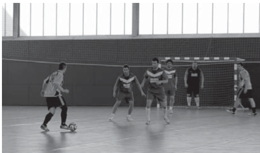
ISU Leihokak taldeak Balerdi harategiaren aurka jokatutako partida.

Gauzak honela, partida interesgarriak ikusi ahal izan ziren Urdaneta H.K., Trumoi taberna, Balerdi harategia eta Indaux taldeek azken faserako txartela jokoan baitzuten. Batetik Indaux eta Urdaneta H.K.-ren arteko norgehiagoka izan zen eta bestetik Balerdi eta Trumoi taldeek ISU Leihokak eta Txindokiren aurka jokatu behar izan zuten, hurrenez hurren.