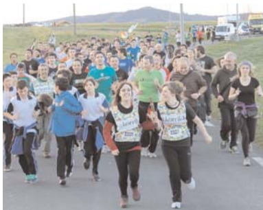
LAB sindikatua eta Erketz Dantza Taldea Kaxkarroko aldan gora! Tipi-ttapa!

Argazki, bideo eta informazio gehiago txintxarri.info webgunean