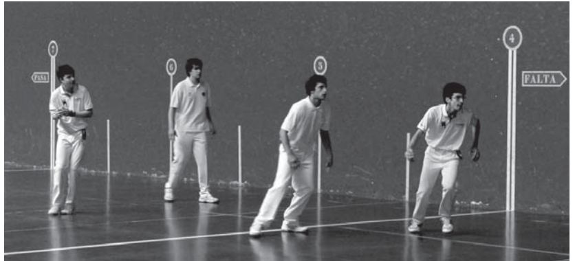
Intzako I. jubenileko bikotea Lasarte-Orian jokatu zen final erdian.