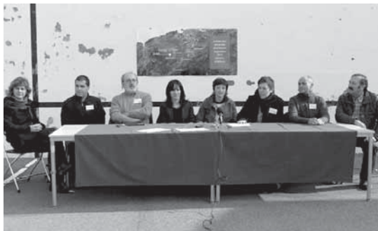
Herrietako alkateak eta Zubietako herri batzarreko kidea prentsaurrekoan.

Zubieta inguruko herrietako alkateek errauskailurik nahi ez dutela argi utzi zuten atzo Zubietako pilotalekuan eskainitako prentsaurrekoan. Era berean, erakundeek proiektua bertan behera uztea eta herritarrei arduraz jokatzeari eskatu zieten.