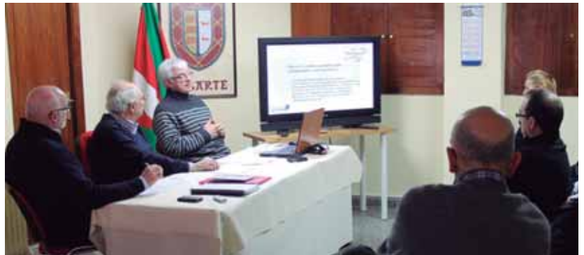
Ganbo Iturri kultur elkartearen egoitzan aurkeztu zuten Pyrenaeus egitasmoa.

Globalizazio handiagoa den neurrian, gizarte dinamikoe-