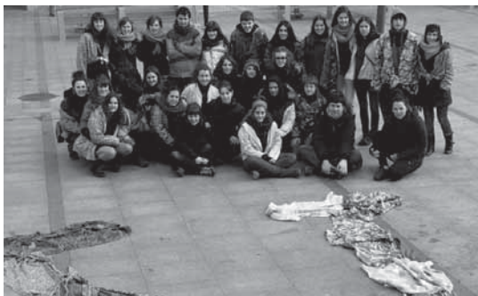
Sorgin Jaiek osatzen duten koadriletako kide batzuek brusekin murala egin zuten.

Hemendik aurrera, Sorgin Jaiek "koordinazio gune" bat