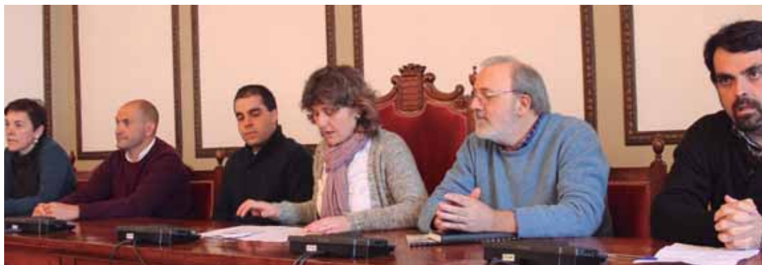
Ezkerretik Usurbil, Hernani, Astigarraga, Andoain, Lasarte-Oria eta Urnieta alkateak asteazkenean egindako aurkezpen agerraldian.

Eskualderako lehenengo enplegu plana aurkeztu dute sei udalek