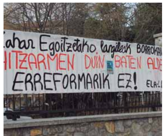
Atsobakar egoitza aurrean euren aldarrikapena jarri dute langileek.

Aipatutako akordioa iritsi ezean, datoen asteetan grebarekin jarraitzeko asmoa dutela jakitera eman dute sindikatuek "eta hauekin bat egingo dute Atsobakar egoitzako langileek ere".