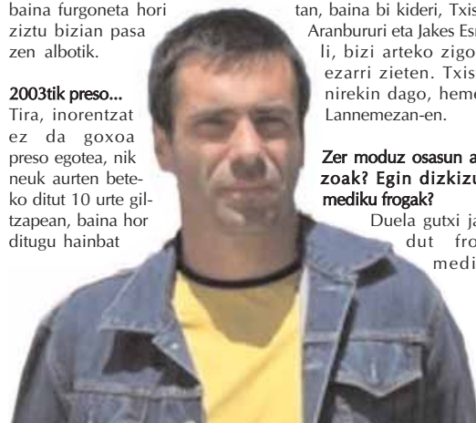
Elkarrizketa oso osorik txintxarri.info webgunean

Penagarriena da ez dutela hau aldatzeko asmorik, espetxea negozio handi bat da eta.