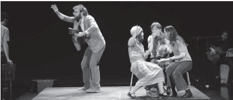
Franco hil osteko garai gorabeheratsuak antzeztu zituen "Dejabu" panpin laborategiaren proposamen interesgarriak ostiralean.