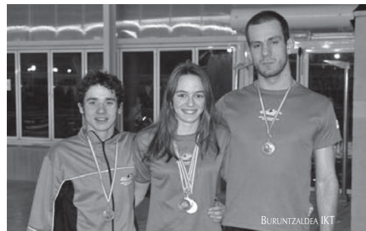
Mitxelena, Tolosa eta Esnal Euskal Herriko Txapelketan lortutako dominekin.

Naiarak 50 m. libre eta 100 m. libreetan Espainiako gutxienekoak lortzea zuen helburu. "Bietan oso gertu geratu zen