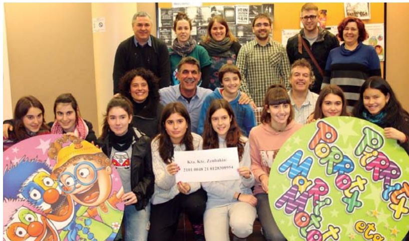
Prensaurrekoan Pirritx, Porrotx eta Marimototsen batera jaialdian parte hartuko duten taldeetako kideak izan ziren.

Jaialdia martxoaren 9an izango da eta honetan Pirritx, Porrotx eta Marimotots haien 25. Urteurrena ospatzen duen "Sentitu, pentsatu, ekin" emanaldiko bi saio