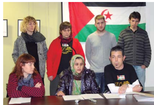
Mendebaldeko Sahararekin bat taldeak prentsaurrekoan eskerrak eman zizkion Udalari.

Honetan parte hartu nahi dutenek Yal-lah Gazte ekimena taldearekin jarri behar da harremanetan facebook bidez.