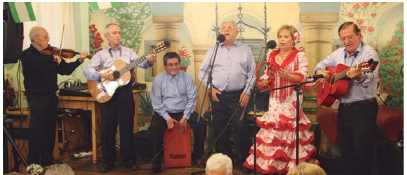
Semblante Andaluz elkarteak dantza eta kantu taldeetaz gozatzeko aukera izango da Andaluzia eguna ospatzeko antolatu diren ekintzetan.

Andaluziaren eguneko ospakizun nagusia igandeko gozto dute herriko andaluziarrak. 11:30etan hasiko da