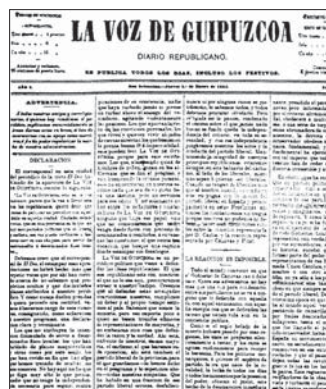
La Voz de Gipuzkoak eman zuen honen berri zehatz.