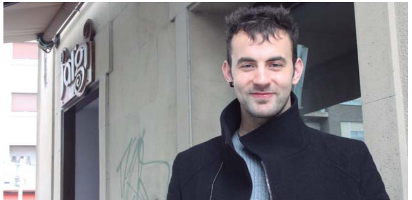
Jokin Telleriak ez du baztertzen X. urteurrena ospatzeko azaroen ekimen berezia egitea.

Oso malguak bilakatu gara. Antolaketa baino gehiago da egun egiten duguna eta bila-kaera esanguratsua izan da guretzat. Geografikoki zabaldu, zerbitzuak eskaini eta urte-