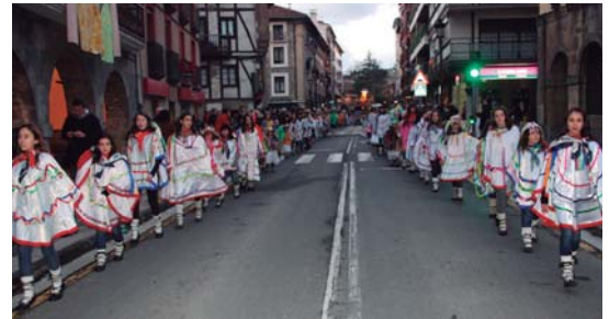
Euskal Inauteriak jai giroan eta ahalik eta jendetsuen nahi dira ospatu.

19:00etatik aurrera Dinbi Bandako batukada arituko da herriko kaleak giroten eta Gazte Klubekoan bingoa egongo da. 20:00etan plazan erromeria egingo da Amalurrekoekin. Gauean karpan disko festa egingo da.