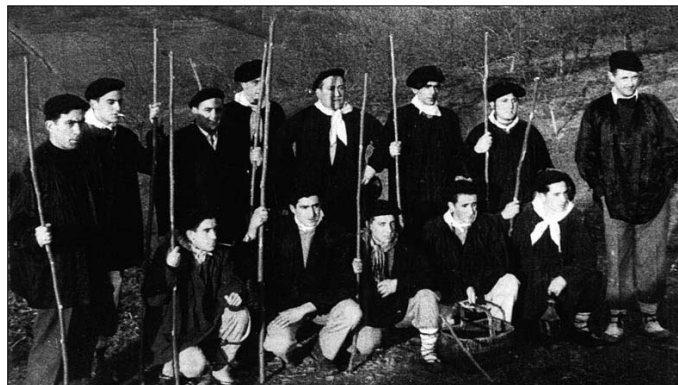
Tomas Hernandezen bildumatik aterako irudian lasarteoriatar koadrila eskean. Denak gizonezko gazteak.

Santa Ageda doinuek iragartzen dute Inauteriak ate joka ditugula. Ohi bezala herrian zehar koplak abesten arituko dira hainbat talde euren makilaz lagunduta. Ohitura honen jatorria ez dago oso garbi zein den, baina tradizionalki baserri eremuan egin eta urteetan mantendu izan da. Baserriz baserri eskean ateratzen ziren gizon gazteak, kintoak izan ohi ziren, soldaduskara joan aurretik, ondoren bizilagunek emandako janariarekin afari ederra egiteko. Abesten diren koplak dagokionez, herrietan geratzen ohi dira bertakoak diren kantak. Izar ere Santa Agedaren omenezkoak gain, beste hainbat gai jorratzen dituzte.