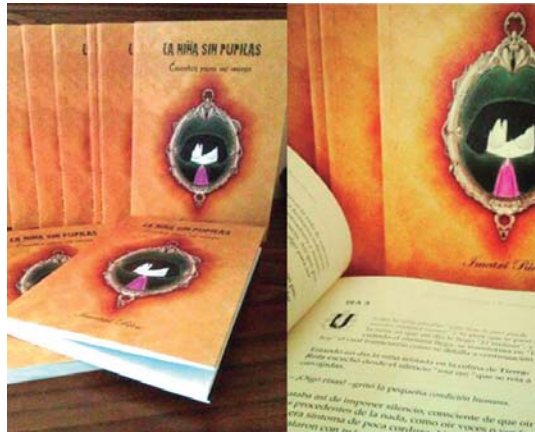
“La niña sin pupilas” liburu herriko liburu dendetan dago.