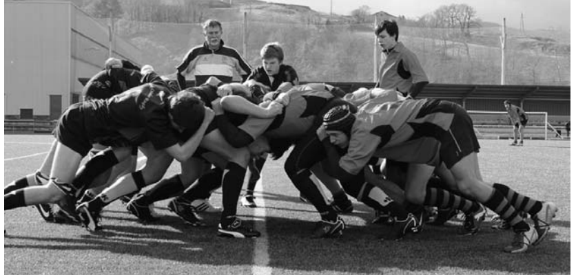
Beltzak-Ostadar (ezkerrean) eta Logroño Sport Taver Rioja Rugby taldea (eskuinean) partiduko mele batean elkarri bultzaka.

Bigarren zatia hasi bezain pronto, 41. minutuan, uztartzea egin zuen Riojak, etxeok defentsako huts nabarmen bat tarteko, markagailuan gerturatu egin ziren beraz kanpo-koak (10-5).