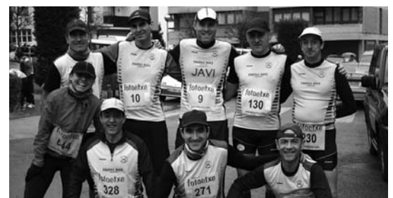
Ostadarreko hainbat atleta Idiazabalgo proba hasi baino lehen.