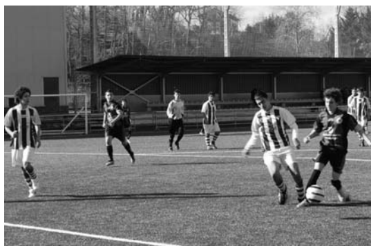
Aukera ugari sortu zituen Ostadarrek Texasen area inguruan, batez ere bigarren zatian.

Bigarren zatian kolore beltz eta urdina izan zuen erabat, Texaseko mutilei partidua luze egin zitzaizen eta