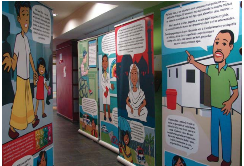
Emakumeen Zentro Zibikoan erakusketa hilaren 15era arte egongo da zabalik.

Batetik elikadura giza eskubidea dela aldarrikatzen da, eta, beraz, munduko esta-tuen bete beharrak direla, eskubidea errespetatu, herritar-rak babestu, hauei behar dutena eskura izatea erraztu eta elikadura egokia ez dute-nei laguntzea.