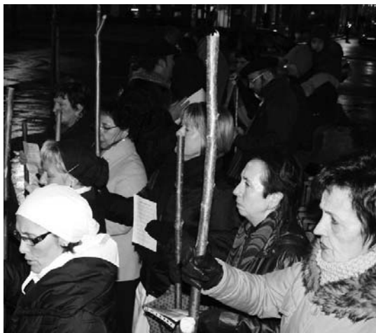
Aurreko urtean hainbat herritar aritu ziren Santa Agedari oles egiten.

Santa Ageda bezpera egunean makilak hartu eta kalera aterako dira herriko hainbat talde, ohitura zaharrari jarraituz, Santa Agedari kantatzera, lurra makilaz kolpatzen duten bitartean. Zenbait historiariren teoriaren arabera, makilarekin konpasa eramanez lurra jotzea loalditik esnatzeko deia da, udaberriko loraldiaren etorrera irudikatzen duen ekintza.