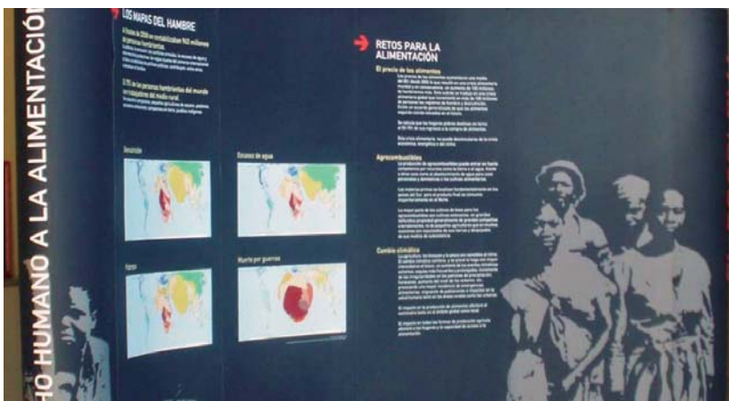
"Elikagaia izateko giza eskubidea" erakusketa Manuel Lekuona Kultur etxean hilaren 28ra arte.

Erakusketan arlo horietan zer egin daitekeen ikusi daite-ke 3. munduko herrialdeetan osasuna oro har hobetzeko.