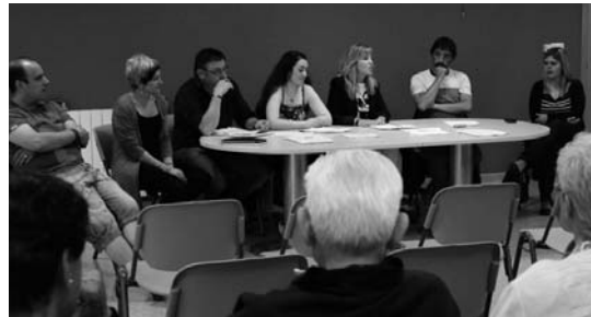
SuBerri akordeoi orkestraren aurkezpena ekainean egin zuten.

SuBerri era askotako estiloak jotzen ditu, jazz, zarzuela, akordeoirako idatzitako musika, euskal musika, eta hauen