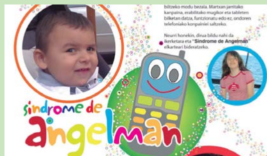
“Eman estaldura zure mugikorrarekin” kanpainako kartelaren bati bat.