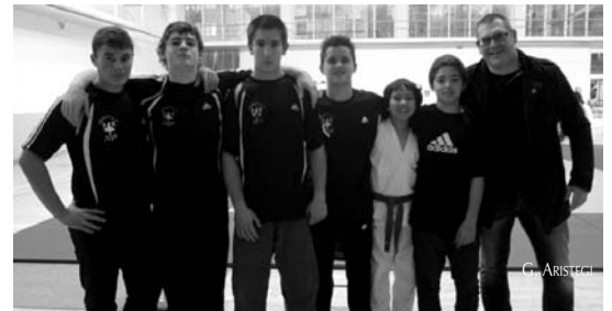
Junior txapelketan eta Eskola Kirolako sailkapenean parte hartu zuten judoek.

Junior mailako Gipuzkoako txapelketa izan zen lehengo asteburuan LOKEko mutilak ederki lehiatu ziren eta bi domina eskuratu zituzten. Bestalde, infantilak ere lan polita egin zuen Eskola Kirola egitasmo-ko sailkapenean.