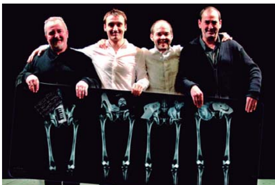
"Ez gara Palestinaz ari" ekitaldiaren karteletako irudian laurak.

Bera hasten da, gai bat oso berea, oso intimoa erabakitzen, nik beste bat eta lehen bertso sorta prestatzen du bakoitzak. Ondoren hau konpartitzen dugu, iritzia trukatu dugu.