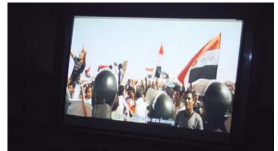
Bardemen "Hijos de las nubes" dokumentaleko fotograma bat.