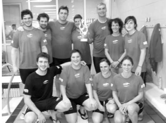
Buruntzaldea IKTko master taldeko kideak eskuratutako sariarekin.