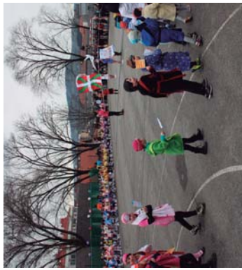
Sasotia-Zumaburu ikastetxearen inguruan ikasten diren ikasleak.