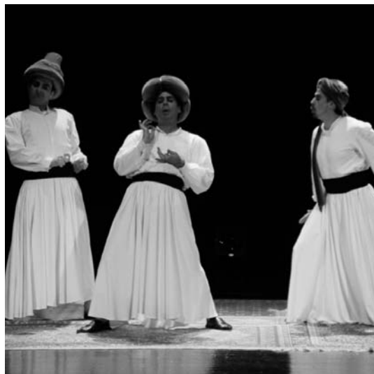
Ali Baba eta 40 lapurren istorioa kontatu zuen Borobil Antzerki Taldeak. TXEMA VALLÉS

Persian egongo balitz bezala sentitu zen ikuslea, 3x2 metroko alfonbra batez lagunduta, bazarrak, basoak, kobazuloa eta istorioko gainontzeko lekuak girotu zituzten, berez ederra eta mezuz betea den istorioari indar handiagoa emanaz.