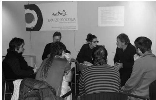
Lan-talde txikitik landu zuten bloke bakoitza. Jendeari parte-hartzeko dei egiten diote.

Azkenik, herriaren alderdiak izan behar duen antolaketa zehazten saiatu ziren, herri batzarrei garrantzia emanaz eta hauen nolokotasunak eztabaidatuz.