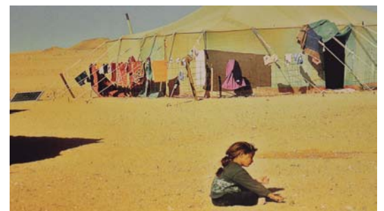
Aurkezpenaren erakutsitako galeriako bi irudi, errefuxiatu kanpamenduetakoak.