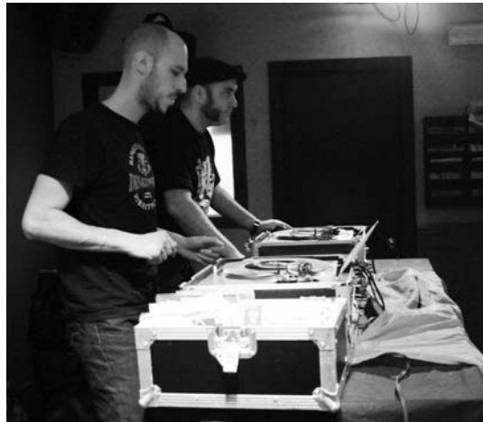
Big Time Sound System-eko "El Quebraley" eta Nakor Selektor pintxatzen, Maun.