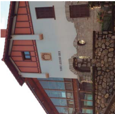
Lasarte-Oriako 18 urte arteko kalitatezko hezkuntza eskuliduna bultzatzen dute herriko ikastetxe guztiak.

Honekin guztiarekin gururako eta gaztearekin gururako eredu berriak, haur eskolara eraman edo "lehen hezkuntza" eraman. Haur ereduaren eredu berriak, haur eskolara eraman edo "lehen hezkuntza" eraman.