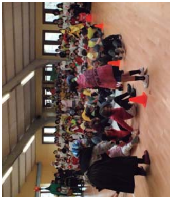
Landaberiako ikasketen erakundearen inguruan ikasten diren ikasleak.

berri eman eta berrikuntzak azpimarratu nahi izan dituzte. Herriko hezkuntza ibilbideari dagokionez, 0-3 urte inguruan hasian artu gara herrian daukan ikasketarako aukerak. Datoren ikastetxerik ez dagoen bitartean, Haur Hezkuntza, 2-5 urte, eta