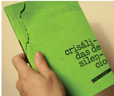
Siarte argitaletxeak asko zaindu du liburuen inpresioa eta azken ukitua. E. ELIZEGI

“Denok bezala, errealitateari begiratzeko nire modu pertsonala daukat, eta nire idatziek hori isladatzen dute”