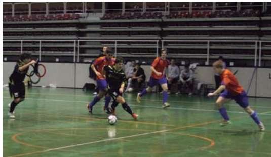
Aldaz HK-k ostirallean Kirolegian jokaturako partiduko une bat.

Honela postu honetan mantendu eta lehen lau sailkatuetan egotea da helburua orain. "Lehengorietan bada