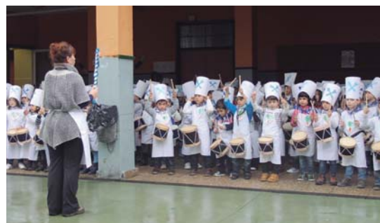
Garaikoetxea eta Zumaburun Haur Hezkuntzako txikiak aritu ziren danborra joz.