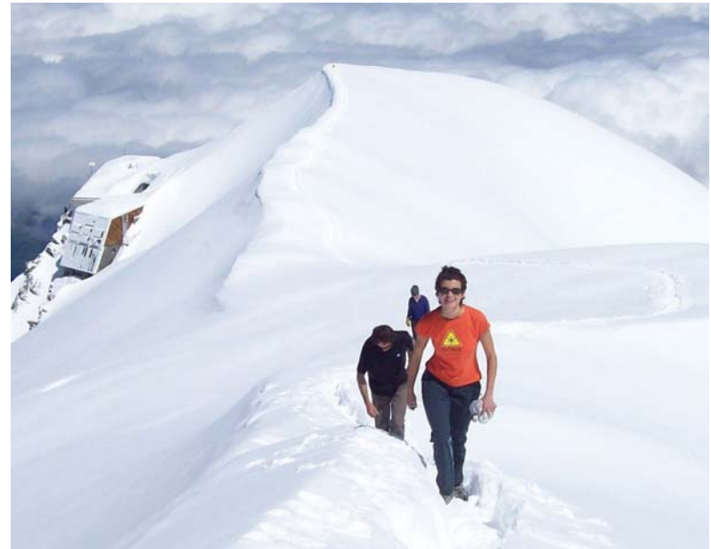
2010ean kaleratu zen “Mi Montaña” liburuan, Mont Blanc-eko Gotter aterpeen, 3.817 metroan 4 hilabetez bizitako esperientzia kontatu zuen. FRANK HIEN

“Denok bezala, errealitateari begiratzeko nire modu pertsonala daukat, eta nire idatziek hori isladatzen dute”