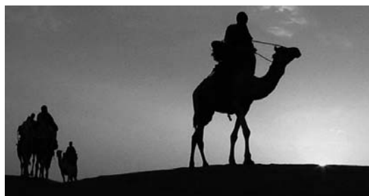
Donostiako Zinemaldian aurkeztutako dokumentala arrakastatsua izan da.

"Hijos de las Nubes" Donostiako Zinemaldian ikusi ahal