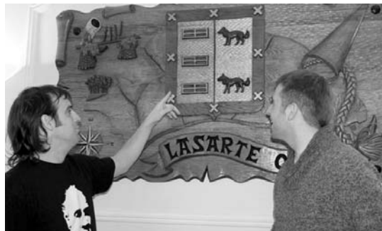
Udalaren irudi korporatiboa erabakitzeko hiru epaimahai izango dira.

Lasarte-Oriako Udalaren irudi korporatiboa berriaren lehiaketara aurkezteko epea bukatu zen urtarrilaren 13an eta orain logo berria aukeratzeko momentua iritsi da. Alderdi politikoen, elkarten eta herritarren iritzia izango da kontuan hau aukeratzeko.