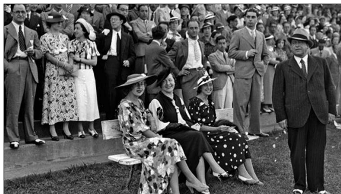
Gure Gipuzkoako bildumatik 1935. urteko argazkia Hipodromoan.

Merkealdi garaia da eta herriko denda guztiek dute erakusleihoetan ikus daitekeen, eskaintza zabal eta deskontuak erakargarriak. Egun hauetan herritar asko deskontu hauek baliatuko dituzte arropa erosteko eta azken tendentzia direnak eskuratzeko. Beti egunean egotea da askoren desioa. Garai batean ere maila, estatusa erakusten zuen arropak, eta hauek ospakizun eta ekimen berezietan erakusten zituzten harro zaldi lasterketetan adibidez. Modak markatutakoak ikusteko aukera zegoen gurean Hipodromora joaten ziren ikusleen soinean. Haien soineko, traje dotoreek eta txanoek atentzioa deitzen zuten inguruko baserri giroan.