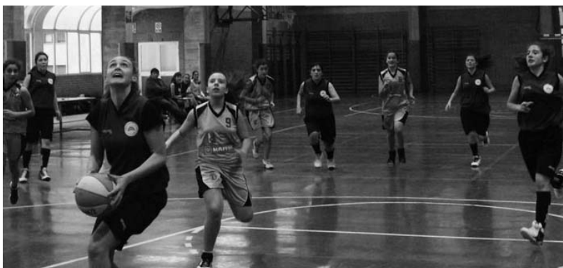
Del Olmo Ostadar SKT taldeko pibota saskiari begira, kontraeraso bat gauzatzeko zorian dela. Azken faserako txartela eskuratu dute.