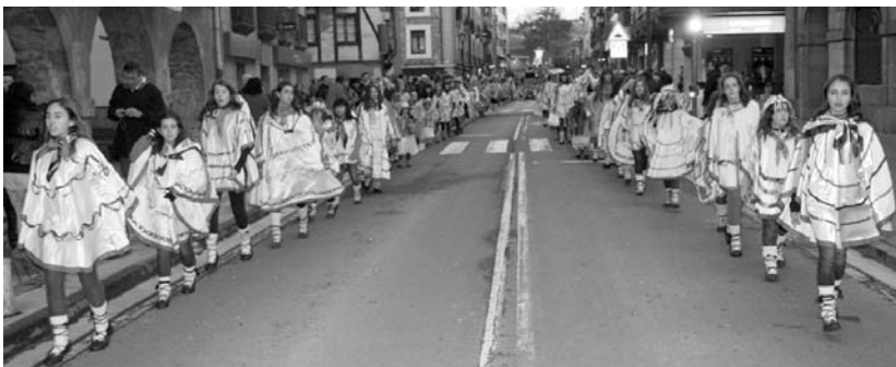
Euskal Inauteriek kolorez beteko dute berriro ere inauterietako igandea. Horretarako, entseguak bihar hasiko dituzte.