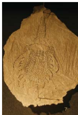
Pilar Soberonen Trilobitae, paper marroian egindako marrazkiak, fosilen artean.