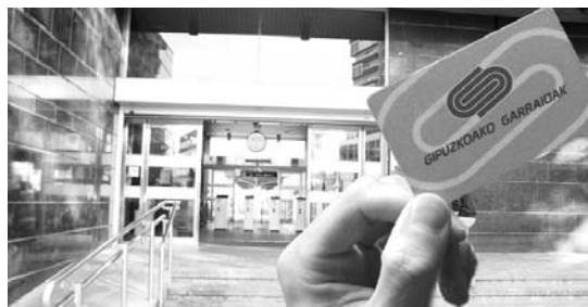
Lurraldebusko txartela erabili daitezke Euskotreneko Lasarte-Oria-Hendaia ibilbidean.

Honetaz gain, urtarrilaren 22tik aurrera, Bilbao-Donos-