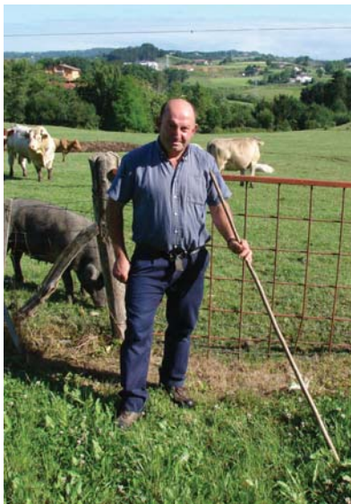
Txekorrak eta txerrikumeak hazten ditu etxeko eta inguruko belardietan.

Neguan porruak, azak, azenarioak,... neguko produktuak izaten ditugu. Gero, udaberri eta udan, denetarik, barazki guztiak aukeran.