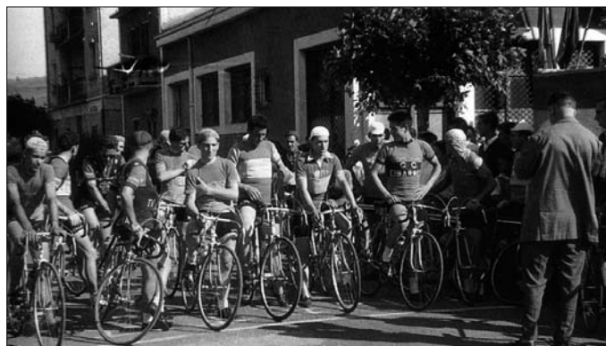
1957.urteko lasterketan txirindulariak ateratzeko prest.

50. hamarkadan oraindik herritarren artean gutxi batzuek zuten bizikleta. Agian arrazoi honengatik asko jarrai- tzen zen txirindularitza eta lasterketak gure inguruan ospatzen zirenean ikusle andana biltzen zen txirindulariak animatzeko. Garai hartan proba garrantzi- tsua zen Michelin lasterketa klasikoa herrian hau 1948.urteetik 1978. urtea arte ospatu zen. 1948an Michelinek txirindularitza taldea sortu zuen profes- sional mailan. Lehenengo profesiona- lentzako lasterketa izan zen eta ondoren afizionatuentzat utzi zen. Talde profesional indartsua izan zen eta taldekako garaipen asko eskuratu zuten.