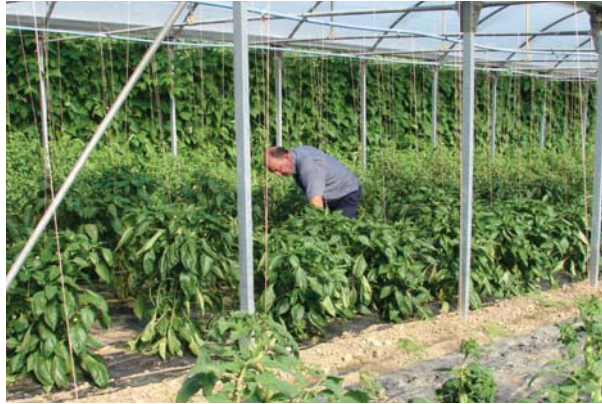
Negutegietan tomatea, piperra eta baina jartzen dute udan. Kanpoan, bestek beste, patata, letxuga eta kalabazina.

Lehen bazuenazuen esnetarako behi batzuek?