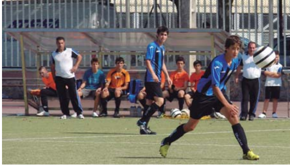
Olaizola eta Gorri aurtengo denboraldiko lehen partidaren, adi-adi baloia begira.

O: Denboraldia hastean, zortzi talde “ukiezin” zeudela esan zigen Euskal Ligan urte asko daramatzan jendeak, eta hori ikusita, jaitsera postuetatik libratzeko borrokan egongo girela uste genuen. Baina ekipoa hazi egin da, sailkapeneren erdian gaude orain.