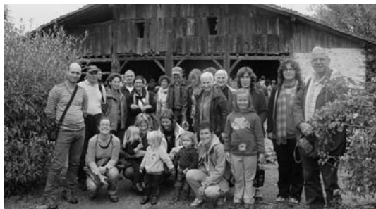
Igartubeiti baserriaren aurrean Oinatz irteeran parte hartu zuten lagunak.

Ekintza 2005.urtean edo lehenago jaiotakoei zuzenduta dago. Abentura parkea itxi-