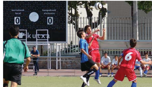
Gogoz ekin zioten jokalariek denboraldiari maila berria. Egun hamargarren doaz 22 puntuekin.