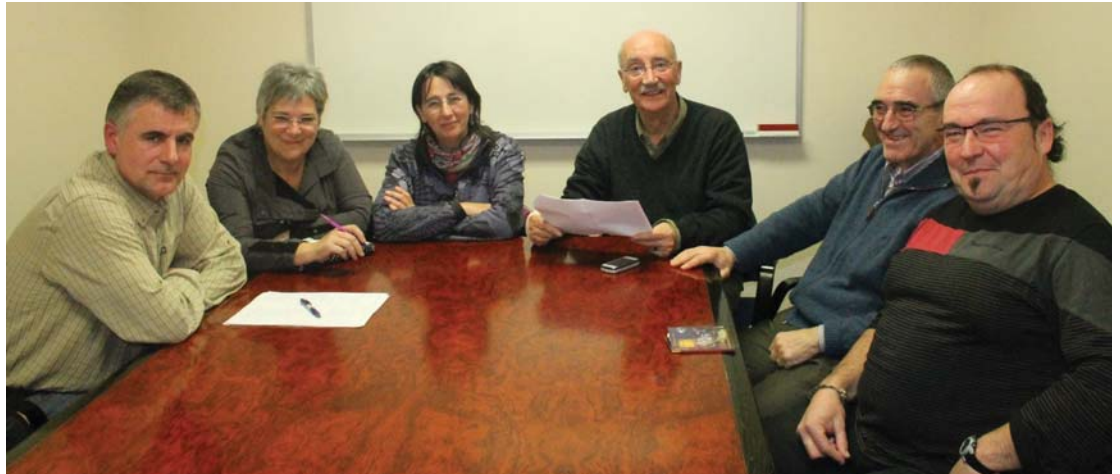
Islada Ezkutatuak taldeko partaideak itxaropentsu dira herritar askok gerra garaiko gertaerak kontatzeko gogoia adierazi dutelako.

Islada Ezkutatuak, izena jarri diote oroimen historikoa gorde dadin lana egingo duen Lasarte-Oriako taldeari, "propio, ezkutatuak hainbat urtetan derri gorrez ezkutatu edo isilduak izan direlako" Aurreko ostegunean Villa Mirentxun aurkeztu zuten eta jendez gainezka egon zen aretoa. Galdera asko ditu taldeak egiteko, baina guk ere galdera batzuk egin genien orain arte egingdako lana eta gerorako asmoak ezagutzeko.