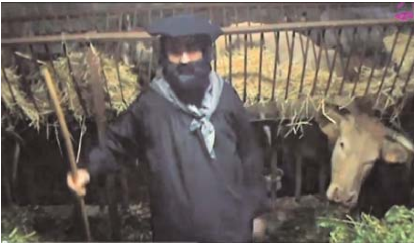
Olentzerok bere baserritik adierazi digu irrikitan dagoela Okendo plazara hurrekin egoteko.