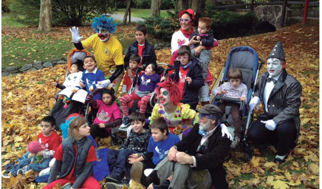
Egutegi elkarteak haurrekin agertzen dira Pirritx, Porrotx, Marimotots eta Takolo pailazoak.

Pausoka elkarteak orain hilabete batzuk plastikozko tapoiak biltzeko kanpaina martxan jarri zuen. Gure herrian hainbat izan dira laguntza emateko prest tapoiak jaso dituzten denda eta tabernak eta orokorrean "lasarteoriatar guztiei gure nahia betetzen laguntza emateagatik" eskerrak eman nahi izan dute. Egutegi solidario bat kaleratu berri dute diru bilketa-ekin jarraitu ahal izateko. Honetan herriko pailazoak garun-paralisia duten elkarteak haurrekin ageri dira.