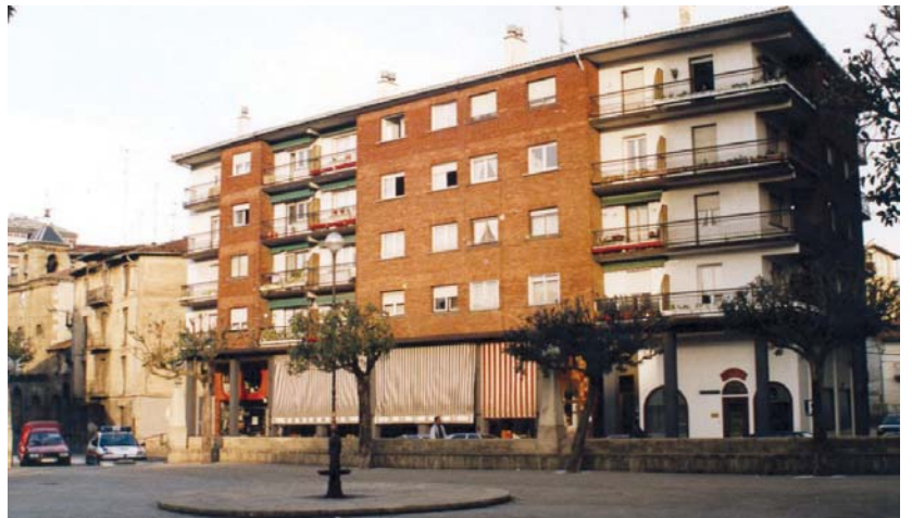
Aniak dendako kideek herria aldatzen ikusi dute. Brigitarren plaza eraberritua, Bikutz dendaren itxea...