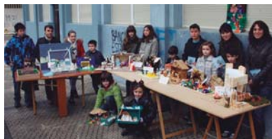
2011ko irabazleek euren lanak erakutsi zituzten sari banaketa egunean.

entregatu behar da. Jaiotzak gaur aurkezteko aukera dago 17:00etatik 19:00etara Danok Kide elkartearen egoitzan Blas de Lezo kaleko 11-13 zenbakian. San Pedro elizan Lehiaketara aurkezten diren lan guztiak Gabonetan San Pedro elizan izango dira herritarrentzat ikusgai eta urtarillaren 1ean emango dute jakitera irabazlearen