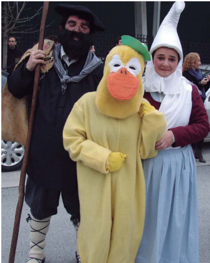
Olentzero eta Mari Domingi astelehen arratsaldean egongo dira Okendo plazan.

Astelehen eta asteartean Xixuko herriko ikastetxeetan izan