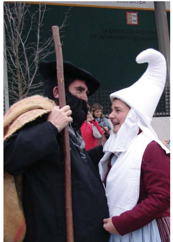
Mari Domingi eta Xixukok laguntzen diote Olentzerori gutunak jasotzen.