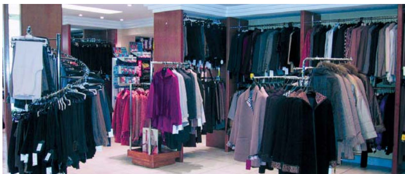
Mota desberdinetako gizonen, emakumeen eta gazteen jantziak izaten zituzten salgai Anaiak dendan.

Eta egun gauza asko aldatu direla adierazi digute, "orain ez da horrela, denboraldi batetik bestera birziklatzen joan behar da. Lehenengotik hasi eta azkenera arte. Ezin