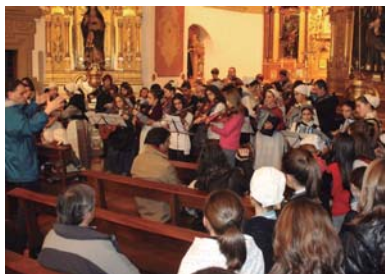
Musika Eskolako ikasle eta irakasleak Ama Brigitarren komentuan egindako saioan.

Okendo plazan herritar andanaren aurrean beste hainbat Gabon kanta jo zituzten txalo zaparrada jasoz.