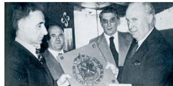
Nafarroako Aldundiak Xalbadorri egindako omenaldian parte hartu zuen Urepelen.