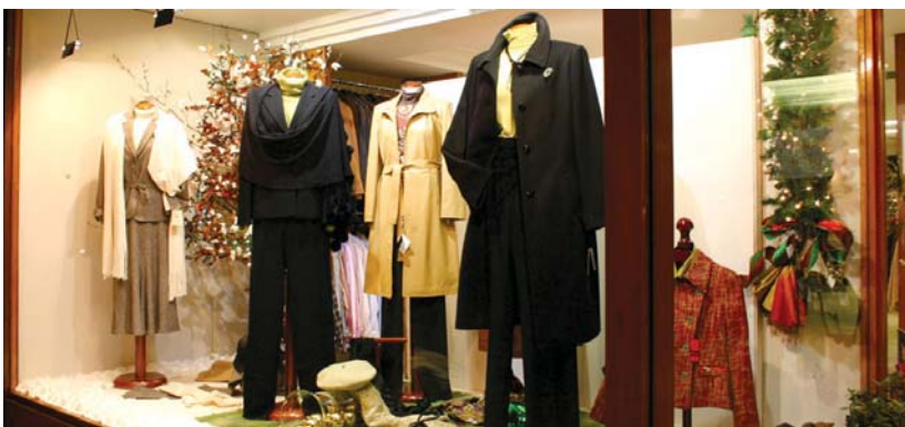
Aniak dendako erakusleihoak beti izan dira zainduak eta ikusgarriak. Garaian garaiko dekorazioa izaten zuten.

Gainontzean "jende ona dago Lasarten. Orain dendan sartzen direnean, "nora joan-gara orain" galdetzen dute, "ohituak gaude hona etor-tzen". Hutsunea utziko dugu eta guri ere pena ematen digu. Baina ez dago atzera buelta-rik, larunbata 22 azken eguna.