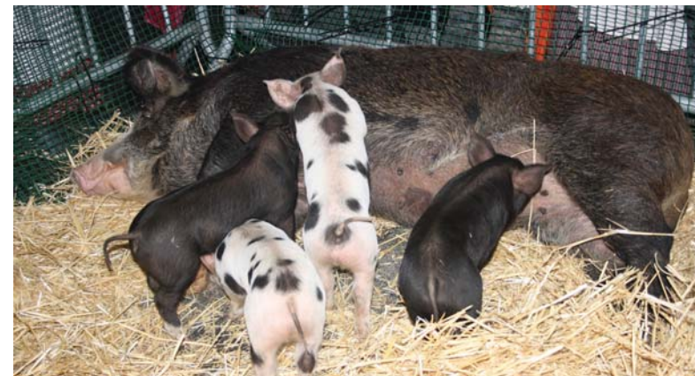
Telleri baserriko txerria ekarriko dute urtero bezala Okendo plazara. Txerria izango da Santo Tomas eguneko gauza ikusgarrietako bat.

Santo Tomas eguna ospatzen dela eta azoka antolatuko du gaur arratsaldean Ttakun elkar-teak Okendo plazan. Urtero bezala ez dira faltako hotzari aurre egiteko, sagardo, talo eta gaztainak, dantza eta gabon kantauk. Berrikuntza bezala aurreten salmenta postu gehiago egongo dira, eta hainbat produktu salduko dira Okendo inguruan.