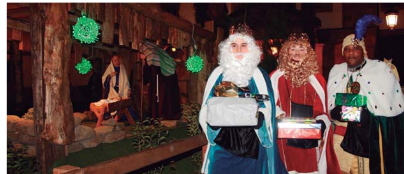
Hiru erregeen etorrera berezia izango da aurtengoa, Udaletxe berritik agurtuko dituzte haurrak eta honen sarreran hartuko dituzte euren eskutitzak.

Abesbatzak 1964. urtean hasi zuen bere ibilbidea eta 70. hamarkadan asko izan ziren eskuratutako sariak. Danok Kide elkarteak antolatutako kontzertua da hau eta sarrera irekia eta doakoa izango da ohi bezala.