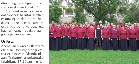
Lartaun abesbatzaren emandaldia izango da abenduaren 28an.

diren langabeei lagundu nahi izan die ekimen honekin".