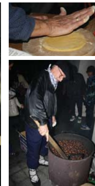
Haurrek taloak egiten ikasteko aukera izango dute, talogile “beteranoen” eskutik. Sagardo eta gaztainarik ere ez da faltatuko Okendo plazan.