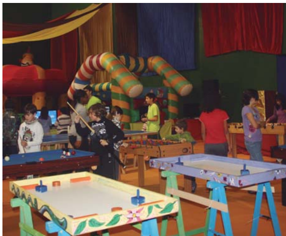
Egunerrietako haur parkeak aurten 12-14 urte arteko gazteentzako gune berezia izango du.

Irabaziak Plataformarentzat izango dira bere osotasunean eta "honen bitartez Lasarte-Oriako udalak nolabait gure herrian egoera ekonomiko larria pairatzen ari