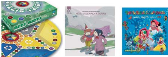
Bizi-bizi Argiaren mahai jokoa da nobedadeetako bat, herriko pailazozen azken diskarekin batera.

Opariak egiteko momentuan gaude eta eskura izaten dugun produktu aukera zabalaren aurrean zer erosi aukeratzeari lan zaila izaten da askotan. Erosketa hauek errazteko parada eskaintzen du www.katalogoa.org web orrialdeak. Bertan euskarazko produktuen katalogo zabala jasotzen da guzti adinkara sailkatuta. Euskarazko musika, filmak, komikiak, jostailu eta jolasak daude aukeran. Etxeko guztientzat opariak topatzeko webgune lagungarria.