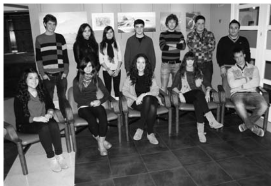
Erakusketa abenduaren 1ean jarri zuten ikasleek.

Erakusketa ikusgai izango da Abenduaren 21a bitartean 18:00etatik 20:00etara astelehenetik ostiralera bitartean.