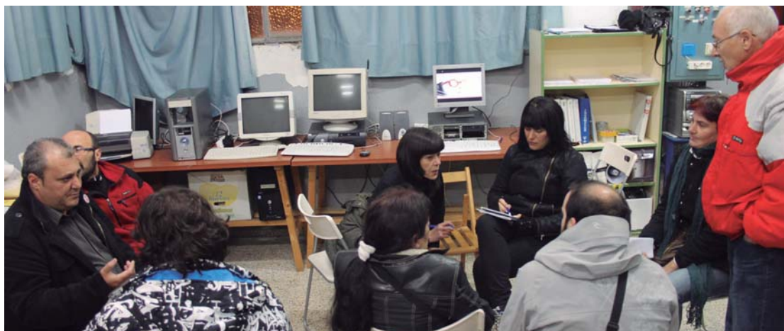
Langabetuen plataformako kideak asteazkenetan biltzen dira etxe kaleratzeen inguruko informazioa jaso eta honen inguruan hausnartzeko.

Bihar, Udaltzaratza izango da, arratsaldeko 18:30etan. Honetan besteak beste, PSE-EEK aurkeztutako mozioa eztabaidatuko da. Prentsa ohar baten bidez alderdi sozialistak jakinarazi duenez, Udaltzaratza taldeari hilabeteko epea ematen dio 2013ko aurrekontuak aurkezteko eta eskaera zuzena egingo du. Oposizioan zaudenean PSE-EEKi gogor salatzen zitzaizuten epeak ez betetzea eta beraz, 2012ko abenduaren 31a baino lehen onartu behar direla azpimarratzen du.