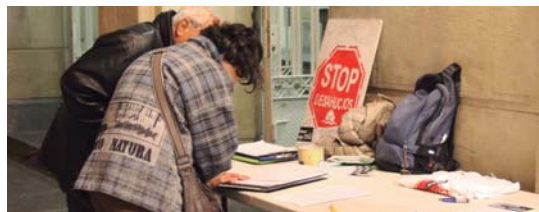
Kaleratzeak Stop! plataformak sinaturak bilduko ditu herrian.

Villa Mirentxun Bartzelonan gertatutako lehen kaleratzearekin egindako "La Plataforma" dokumentalaren emanaldia eta solasaldia egingo dira. "Oinarritzakoa da jendeak ahalik eta informazio gehien izatea egoera honen inguruan eta horretaz gain, Kaleratzeak Stop! taldeak, momentuz Donostikoaren bitartez, abokatuak eta aholkulariak ditu laguntza emateko prest".