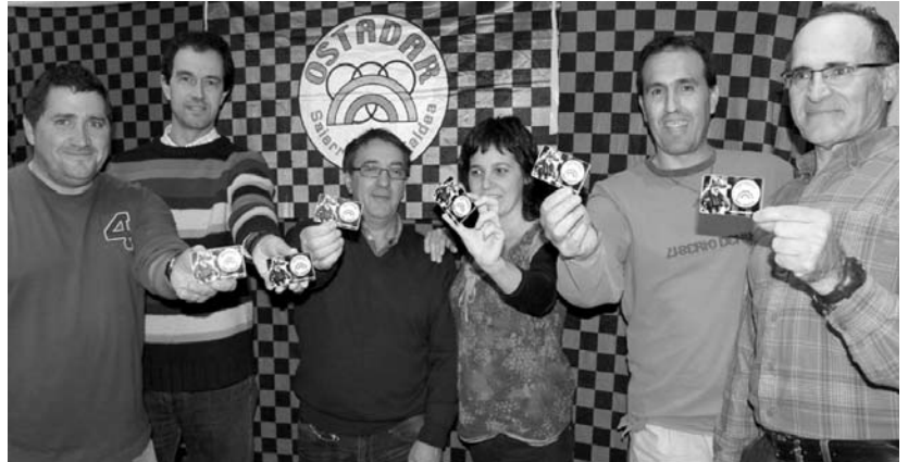
Ostadar SKT-ko sail desberdinetako lagunak elkarteko bazkide txartelarekin.

Kirol elkarteak gogoratu nahi du egun indarrean dau-