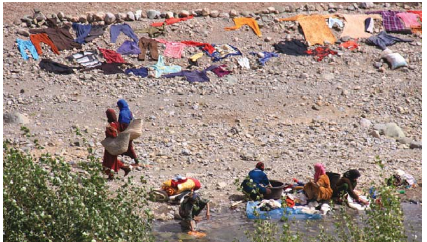
Emakumeek ibaian arropa garbitu eta eguzkitan harrien gainean lehortzen dituzte.