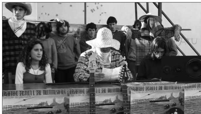
2002an aurkeztu zuen Txorimalo kolektiboak lehen gau multimusikala.