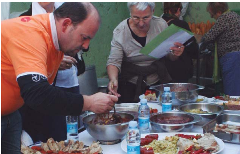
Epaia mahaiakideek zaila izan zuten aurrekoan babarrun hobereak aukeratzea.

Lehen igoera, 8:30ean izango da larunbatean, urriak 20 eta Ostadarreko kideek