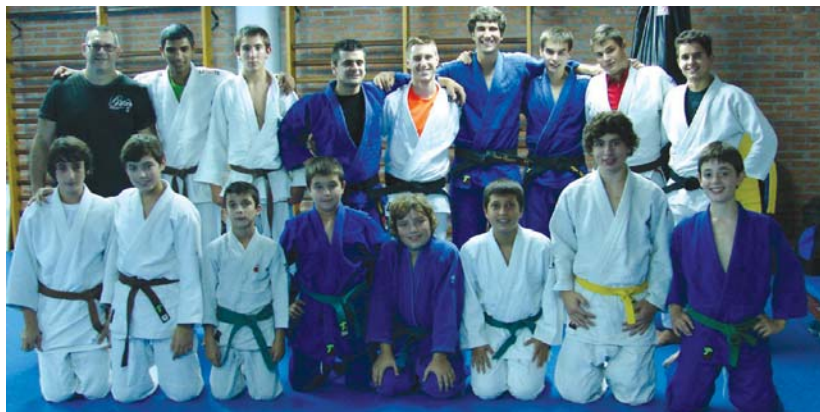
Maila desberdinetako judokak lanean gogor ari dira kiroldegiko tatamian iazko emaitzak berdindu eta gerriko beltzak edo danak lortzeko.

Asteburu honetan berri, Hondarribiko Ama Guadalupeko taldearekin Palermora