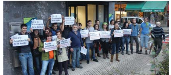
Kutxaren aurrean protesta egin zuten Bilduko kideek ostegun arratsaldean.