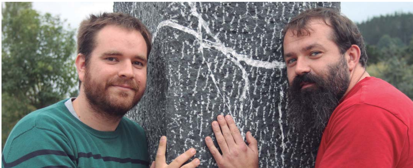
Bikotea lotsati azaldu arren, ezkontzaren inguruko hainbat detaile eman nahi izan zizkigun.