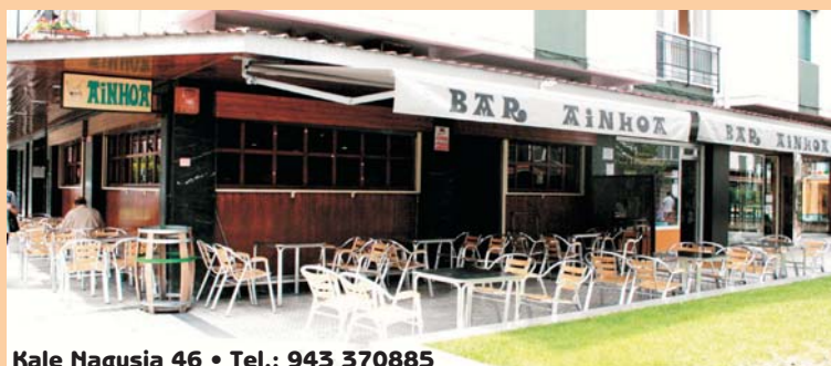
Kale Nagusia 46 • Tel.: 943 370885