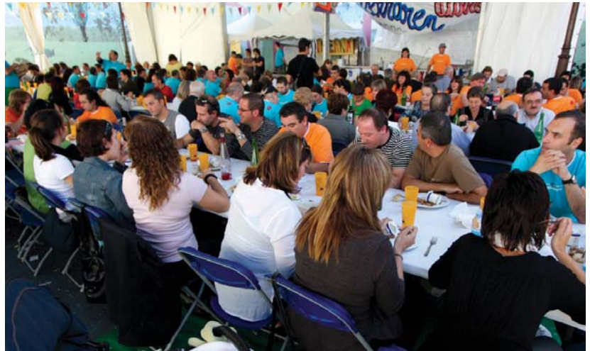
Paella gozoa, txekor erreka edo babarrun jana izango dira Euskararen 8. Maratoian. Txosna ere egongo da Okendo plazan.

Era berean, herritar batzuk babarrun txapelketan egindako eltzekadak dastatzeko aukera ere izango dutela