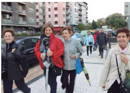
Lasarte-Oriatik ateratako ibiltariak goizean goiz, Aginara abiatu aurretik.

B uruntzaldeko 5. Ibilbideen Beguna izan zen igande goizean. Aurreko urteetako protagonistak familiak eta haurrak izan baziren ere, aurtengoan ibiltari helduagoak osatu zuten Aginagarainoko bidea. Mendiko botak jantzi eta Santueneatik barrena, Aginagarainoko bidea egiten ausartu ziren hainbat herritar. Guztira 9 kilometroko ibilbidea osatu zuten, eguraldi petral xamarrek uneoro mehatxatu bazituen ere. Ostadar SKT-eko Mendi saila pozik zen deialdiak izandako oihartzunarekin.