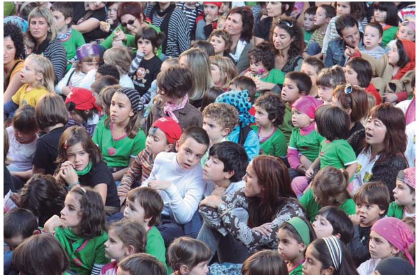
Haurrek beti izan dute Maratoian euren tartea eta pailazo, mago edota ipuin kontalariak beti harrera ona izan dute.

Lehenengo aldia da horrelako “bataio” masiboa antolatzen dela Euskararen Maratoia baita eta herriarren erantzuna ere handia izatea gustatuko litzaieke