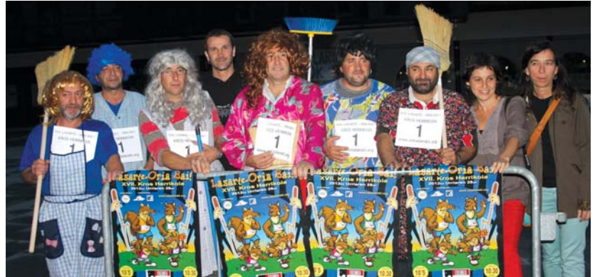
Aurkezpenean Ostadar SKT-ko arduradunek 1 dortsala eraman zioten kotxe-eskoba taldeari.

Aurkezpen ekitaldian aurreratu zuten, izen-ematea gaur, urriaren 15ean, zabalduko da eta urriaren 24an itxiko da.