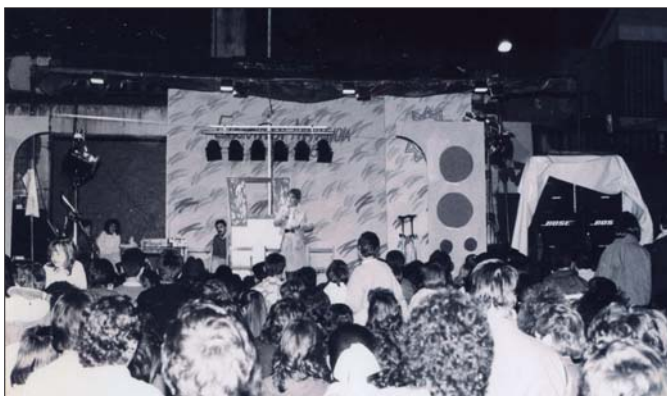
Lehen maratoi hartako argazkia dugu hau, oholtzta txikia baina jendetza plazan euskarari babesa emanez.