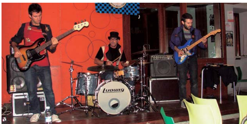
The Garax egur betean aritu zen eta Glazz-en musika psikodelikoak Jalgiko publikoa erakartzeaz gain, harrapatu ere egin zuen.

Usurbilgo Odolaren Mintzoa, Hernaniko Oi dek Oi eta Donostiako Besteik-pe aritu ziren egurrean Okendo plazan jarritako ohotzian.