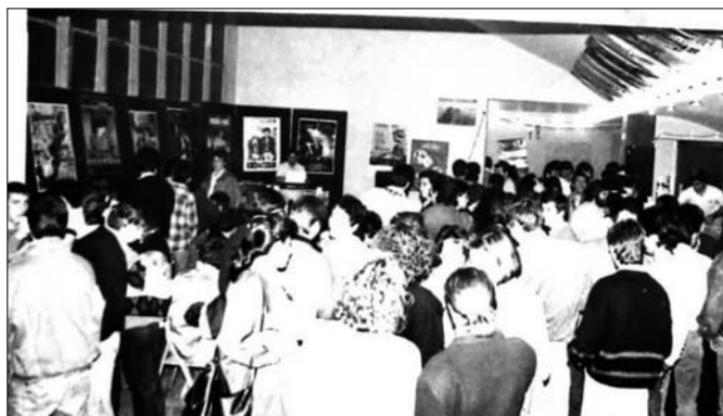
Okendo zinema taldeak antolatutako Zinema astean Tedosoko teknikariak 1987an. Txema Vallés