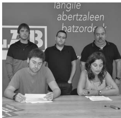
ELA eta LABek ostegunean jakinarazi zituzten bakoitzak bere aldetik greba orokorra egiteko arrazoiak.

E LA eta LAB euskal sindikatuen ustez greba egiteko arrazoi ugari da eta horregatik aktiboki parte hartzeko eskatu diete langileei. Batez ere diru publikotik bankari 100.000 milioi euro "oparitu" zaiola salatu dute eta aldez herritarrentzat ez dela "miseria" besterik: murrizketak, erreformak, pribatizazioak, zerga igoerak eta soldata jaitsierak, besteak beste. Beraz politika publikoak errotik aldatzeko eskatuko dute irailaren 26an.