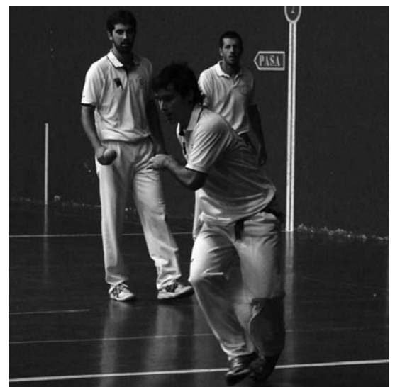
Intzako seniorrek pilota aldaketarekin asmatu zuten, hor egon zen partidua gako.