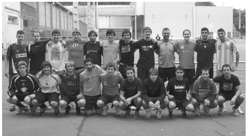
Ostadar SKT-ko Erregional Ohorezko mailako jokalariek gogor egingo dute lan maila berrian haien hoberena emateko.

Gainera, kontuan izan beharreko puntua aipatu digu, "Ostadarren esperientzia ez da maila honetan izan, ez dugu aurreko urteko erreferentziarik".