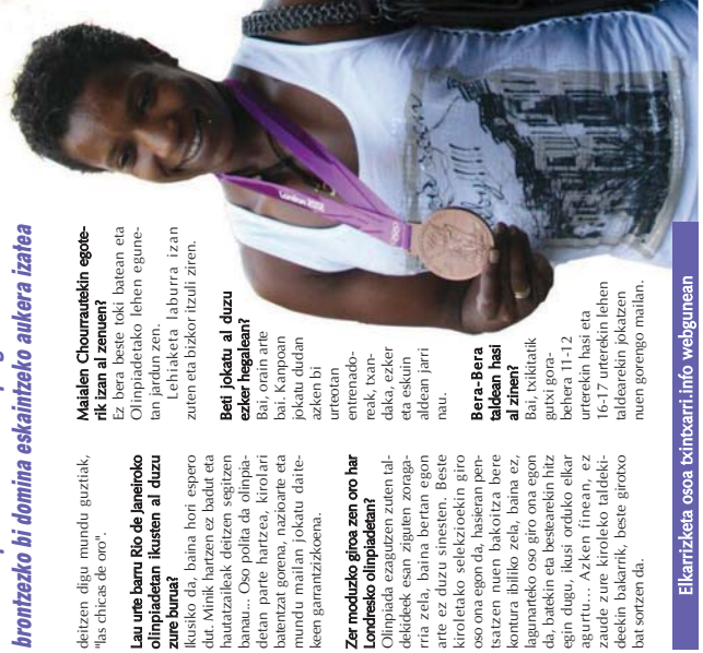
Elkarrizketa osoa txinarrri.info webgunean

Zer moduzko giroa zen oro har Londreseko olinpiadetan? Olinpiada ezagutzen zuten taldekiek esan ziguten zoragarria zela, baina bertan egon arte ez dugu sinesten. Beste kirolatiko selekzioekin giro oso ona egon da, balsegen postuetan nuen bakartza bote kontura ibiliko zela, baina ez, ligunatiko oso giro ona egon da, baina eta besteekin litz egin dugu, futsi orduko elkar-zaude zure kiroleko taldekiekin bakarrak, beste giroko bat sortzen da.