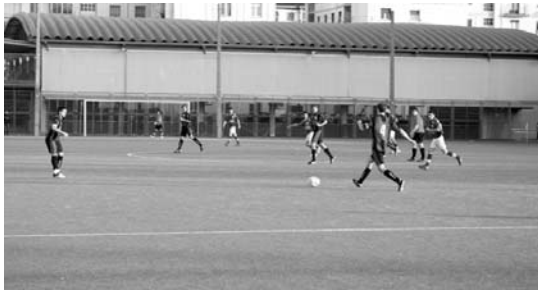
Kirol guneke futbol zelaiko egoera ez da egokia. Kirol taldeen eskaera dela eta, aldatuko da.