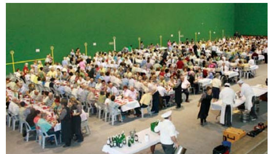
Igandean, ohikoa den bazkari herrikoia izango da kirolguneko pilotalekuan.

Martxa neurtuan eta pala txapelketako inskripziorako azken eguna gaur, irailak 14 izango da.