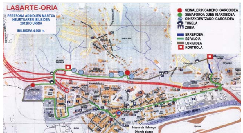
Larunbatean, ibilbide neurtua izango da gure herriko kaleetatik zehar. Gaur da honetan izena emateko azken eguna.

ko ezteiak egin dituzten bikoteei ororigarri banaketa egingo zaie. Eta ospakizunekin amaitzeko afari-merienda eta dantza izango dira.