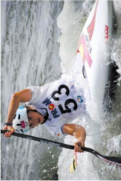
Maialen Chourraut herritarnek bigarren postua eskuratu zuen Joko Olimpikoetan Rio de Janeiron.

■ Brontzezko domina eskuratu zuen herriko palistak Londresko Joko Olimpikoetan ■ Orain bere helburua hemendik lau urtera Rio de Janeiron ospatuko diren Jokoak dira