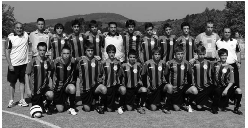
Ostadarreko mutilek Kadeteen Euskal Ligan estreinatu aurretik, Bosta, Gorri eta Olaizola prestatzaileak aldamenean dituztela.