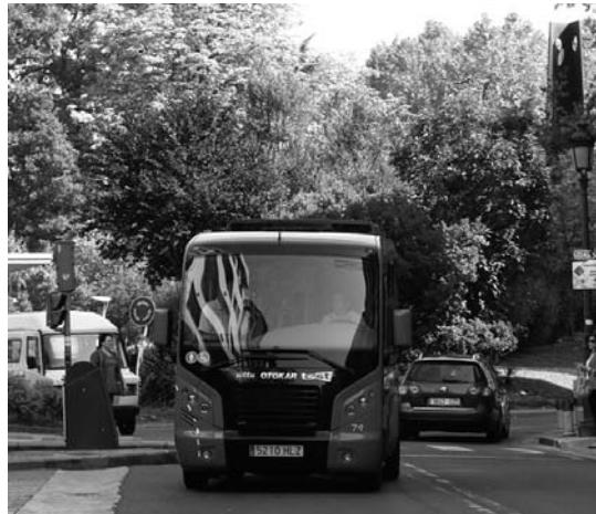
Irudi erakargarria du Manttangorri herriko autobusak.

Manttangorri 21 bidaiari eta gurgildun aulki bat garraiatzeko lekua du eta garraio publiko zerbitzuekin udaletik espero dute herritik egiten diren desplazamenduak autoetan egiteak, Man-