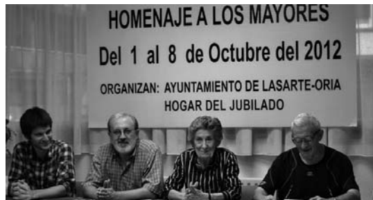
Alkatearekin batera aurkeztu zuten ekintza egitaraua.

Urriaren 1ean Toka, igel eta bote txapelketak egingo dira Isla plazan eta Mus txapelketa jubilatuen etxean. Urriaren 2an Sun Magoaren eta Adolfo Perez bakarriketariaren emanaldiak ikusi ahal izango dira jubilatuen etxean. Urriaren 3an berriz, jubilatuen etxeko soinketa eta aerobic taldeen erakusketak izango dira Okendo plazan. Urriaren 4an paleta txapelketako finala Loidibarrenen