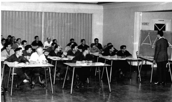
Michelinek helduen eskola zabaldu zuen. Tomás Fernández