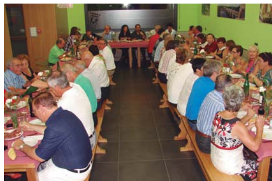
Alderdi guztietako udal ordezkariek, bazkideak eta gonbidatuak izan ziren afari ofizialean.