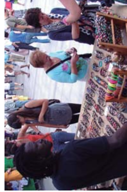
Artisauren elkarturako postuak Mercero plazan jarri ziren, eta eskulaguntzaileak, Okendon.