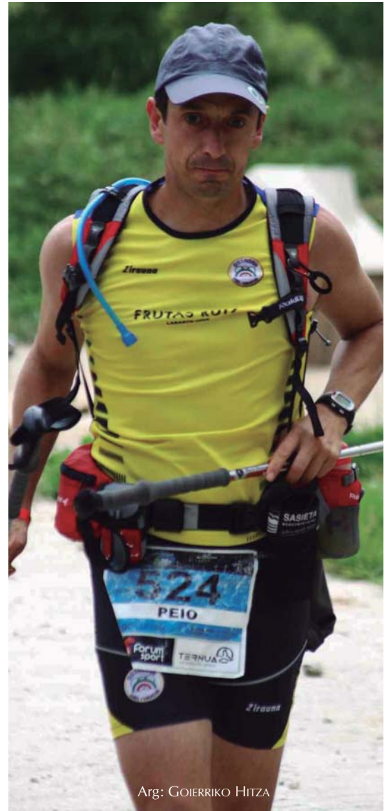
Arg: GOIERRIKO HITZA

Nik berez denbora gutxi daramat, urte gutxi batzuk, beraz aholku asko ezin eman. Baina erronka zailgiak ez jartzea esango nieke. Lehenik eta behin mediku-azterketa egitea gomendatzen dut, nola zabil-tzan ikusteko, zure pultsazioak zein diren jakiteko, pixkanaka joatea funtsezkoa da, eta gustatzen bazaizuz aurrera. Parrandak botatzea ez dut gaizki ikusten, noiz-behinka egin behar dira.