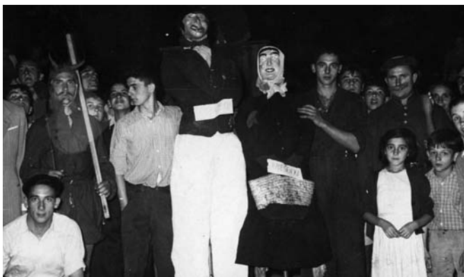
1952. urteko irudia da besteak beste, parodiako deabrua, mikelteak eta akusatua daude.