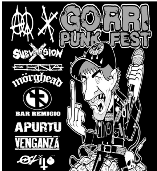
Gorri Punk Fest jaialdiko kartelean taldeak eta "Gorri"-ren karikatūra ikusi daitezke.

Antolatzaileek adierazi digutenez, "Apurtu donostiarak, Ernia zarautzarrak, Venganza Zaragozatik, Obito eta Mörghhead Lasartetik, Subver-