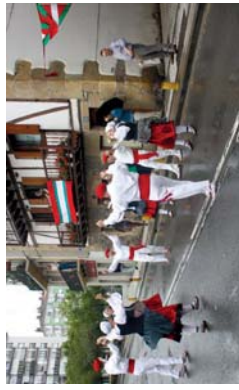
Santa Ana barikaban egundian dantza egingo dute Elkartz EDTko lagunek.