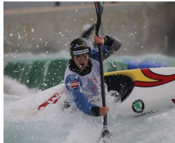
Londresko kanala zaila baina gustukoa du lasarteoriarrek. Aurten behin baino gehiagotan izan da bertan ondo ezagutzeko. ATSS

Nire buruarekin egongo naiz borrokan, irteeran zentratua egoteko. Ez naiz besteen aurka lehiatzen, bana-ka jaisten gara, nik nire jaitsieran gauzak ondo egin behar ditut, beraz, ni naiz nire lehenengo arerioa.