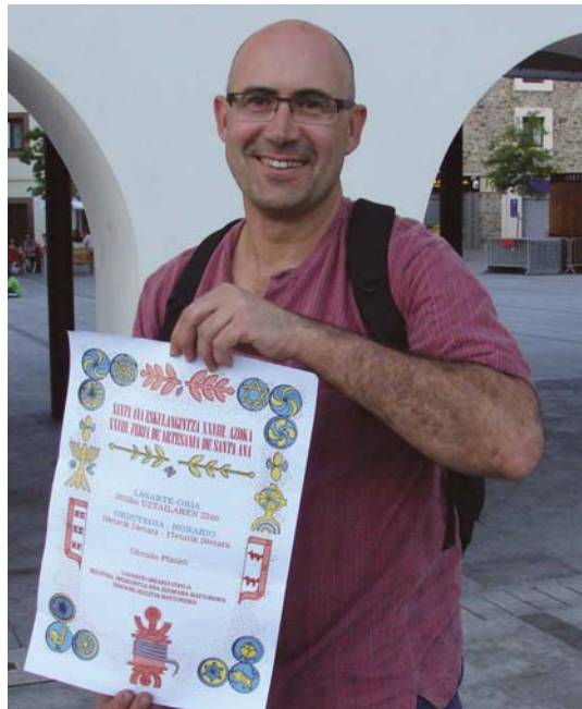
Artisaubaino azoka Okendon eta elikagaiena Mercero plazan egingo dira. Arkupea da muga.