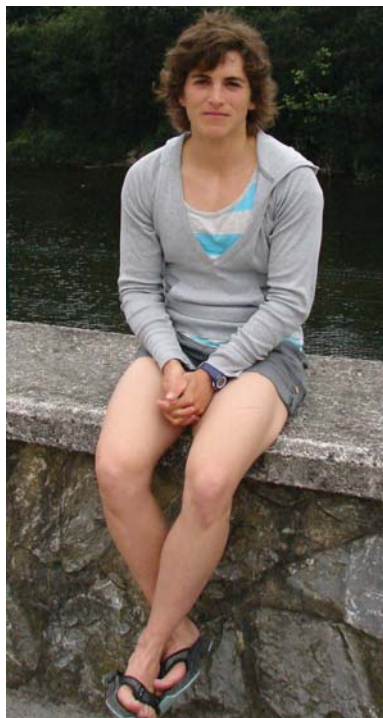
Maialen Chourraut, Ori ibai ertzean, aurreko astean.

Ondo, egia da azken lau urteotan maila onean aritu naizela entrenatzen eta baita lehiatzen ere, eta benetan gustura aurkitzen naizela. Gogor entrenatu dut, pila bat, eta joko hauetara gogoaz iristeko mentalizatzen egon naiz azken lau urteotan. Argi dago modu onean entrea-