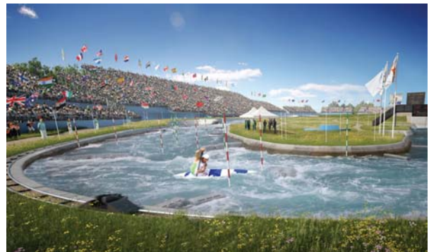
Lee Valley White water centre-a 2010ean eraiki zuten bertan olinpiar slalom proba egiteko. Uztailean 30ean hasiko da.