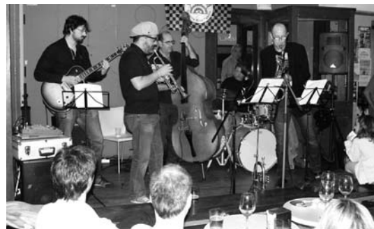
Zuzeneko interesgarriak eskaini zituzten bi taldeek, jazz Tutti Frutti Project taldearen eskutik Jalgin eta funk eta bluesa The Romanticos-en eskutik Abend-en.

Boskoteak Bateria, kontrabaxua, gitarra, tronpetea eta saxo banaz, herritarren belarriak gozarazi zituzten solo eta inprobisazio tarte luzei esker eta txalo zaparradak jasotzen zituzten bakarkako