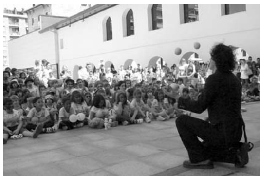
"Mr Frack"-en malabareekin ederki gozatu zuten herriko haurrek.

Kale antzerki ikuskizunak eta zinema eskainiko dira Okendo plazan uztailean zehar. Ostegunean "Extraterrestre" filma eskainiko da gaueko 22:00etan.