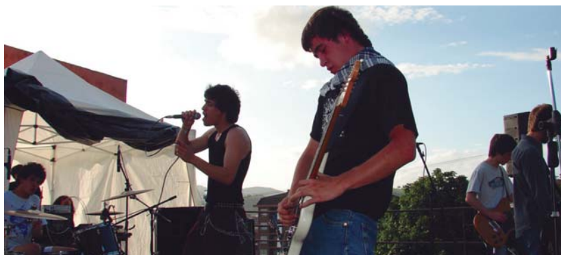
Itxura polita zuen Parapetoko arratsaldean, jendea gustura aritu zen kontzertu desberdinez gozatzeko.

harrera itzela izan zuten publikoaren aldetik.