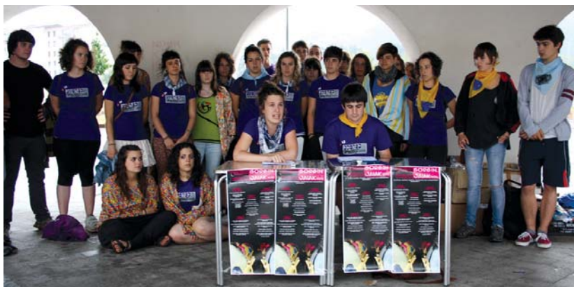
Sorgin Jaiek aurten Okendo plaza, herriaren bihotza San Pedro jaietan taupaka jarriko dute ekintza ugariekin.

Asteazkenean aurkeztu zuen Sorgin Jaietako batzordeak San Pedro jaietako egitaraua. Aurten Udaletxearen oztoporik gabeko jaiak antolatu dituzte gazteek eta kokaleku berria izango dute, Okendo plaza. Honela, herriko gazteek ekainaren 27an hasi eta uztailearen 1ean amaituko diren jaiak taupada biziz beteko dute plaza.