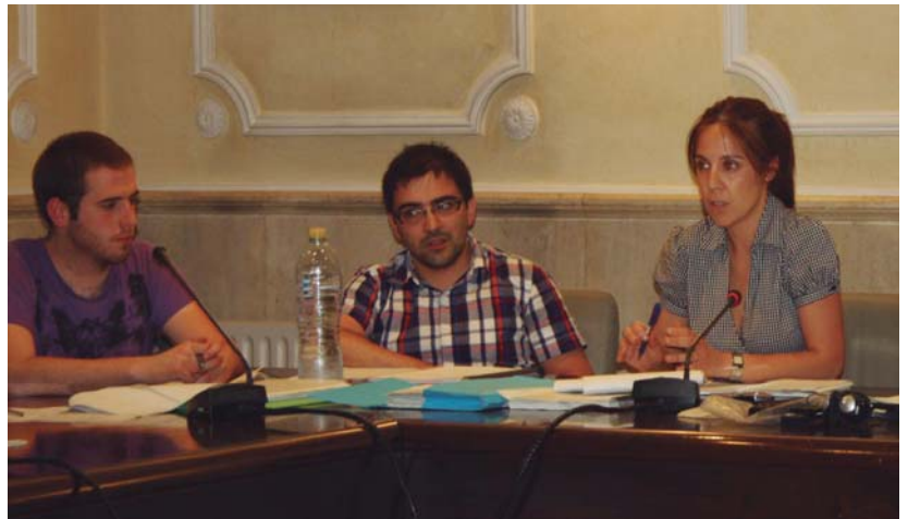
Estitxu Alkorta Ogasun Batzorde buruak aurrekontuak defendatu zituen buruarekin egindakoak izan direlako.

Kontutan izan behar da 2008ko aurrekontuak %43a