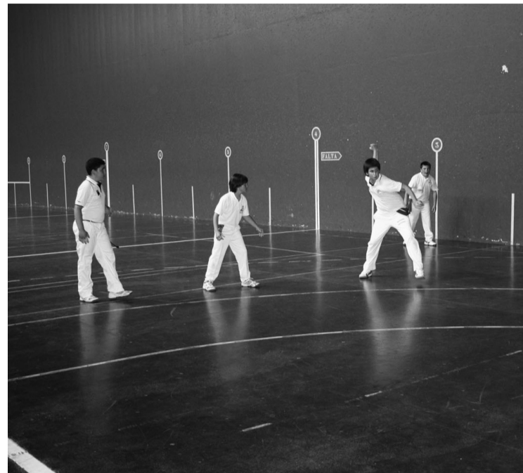
Tanto gogor eta luzeak lehiatu zituzten Intza eta Gaztelekuko lau pilotariek.

Partidu guztian zehar joan ziren aurretik, partidua erritmoa euren nahierara eramanez.