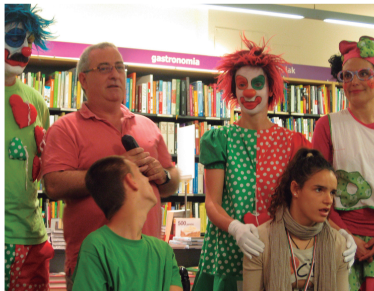
Pailazoen batera kirolari gazteenek euren dominak erakutsi zituzten aurkezpenean.

Pailazoen azken abentura koloretsu eta alai honekin kirol egokitua hurbildu nahi zaie etxeko txikienei eta pertsonen bertuteak gabezien gaitzengatik daudenaren mezua zabaldu nahi dute istorio honen kontakizunarekin.