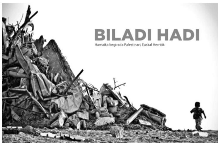
Diska-liburuko portada. Honetan proiektuko argazkiak eta hainbat istoria aurki daitezke.

Erakusketa berezi hau urte osoan zehar Euskal Herriko hainbat herritan egon da eta oraingoan gure herrian izango da ekainaren 22ra arte, arra-