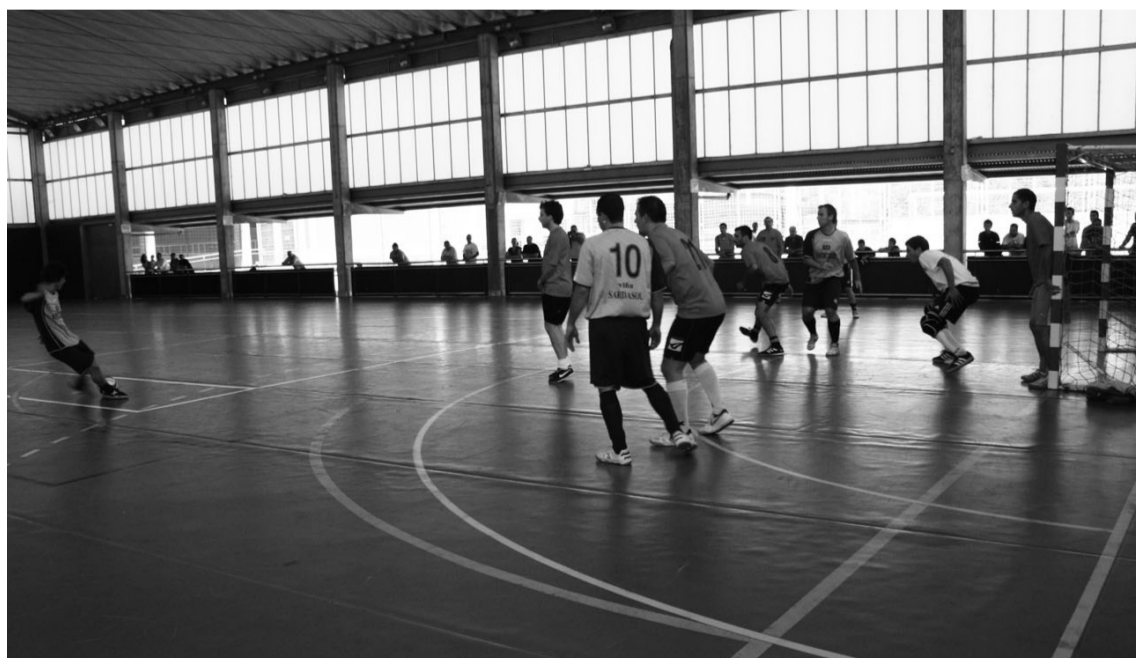
Buenetxea eta El Punto tabernen arteko finalerdia oso borrokatua izan zen eta azkenean Buenetxeak egin zuen aurrera.

ISU eta Buenetxea finalera.- XXIX. Mosso Oroimenezkoaren finalerdiak jokatu ziren larunbat goizean Michelingo kirolgunean. Lehen finalerdian ISU Leihoak eta Txindoki aritu ziren aurrez aurre eta partidua honek ez zuen zalantzarako tarterik utzi, ISU 5-0eko emaitzarekin gailendu baitzitzaion Txindokiri. Bigarren finalerdian ere gol asko izan ziren eta El Puntok 7-2ko emaitzaz irabazi zion Buenetxeari. Hortaz, El Punto eta ISU Leihoak dira aurtengo finalistak. Mosso memorialaren finala datorren larunbatean jokatu da kiroldegian, 11:00etatik aurrera.