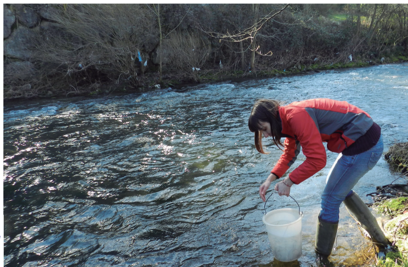
Aztiko biologo taldeko kide bat angulak errekan sartzen martxoan egindako azken ekimenean.