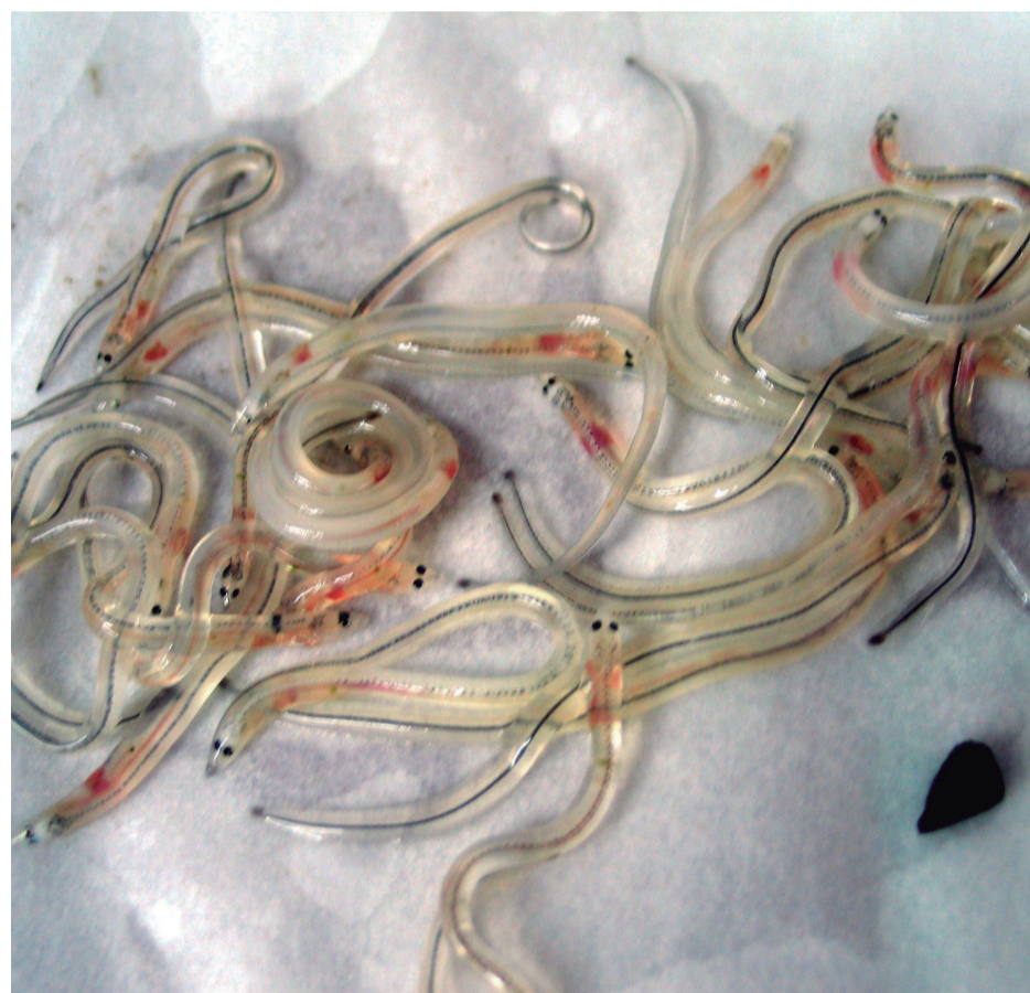
Angulak gertutik ikusita. Hauek dira biologoek errekarra bultzatutakoak.