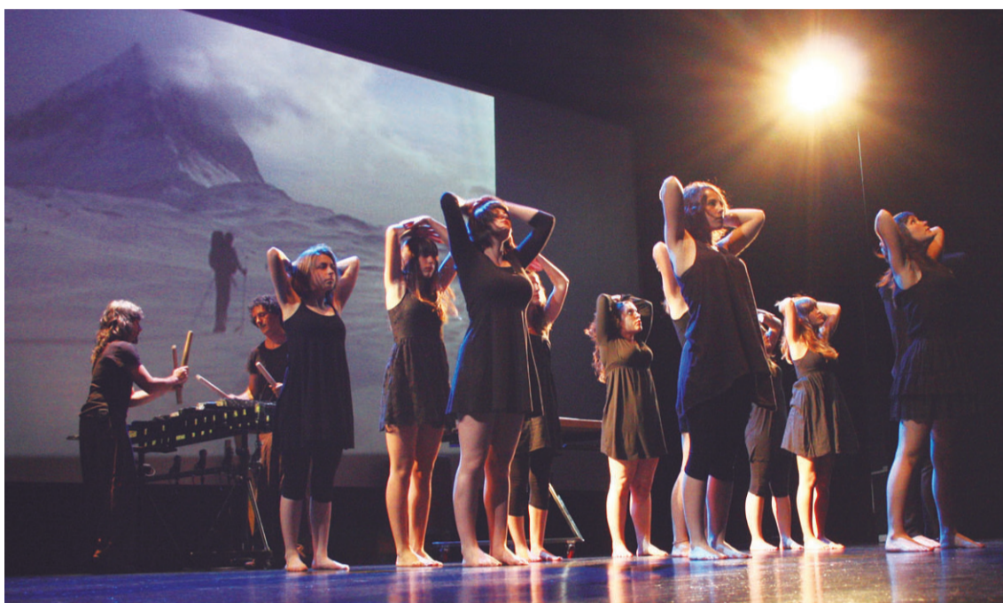
Zuzeneko musikaren indarrak, Kukukako dantzari abileziak eta Nomadak Tx pelikularen irudiek ikusgarri egin zuten emanaldia.

Munduan zehar txalapartaren soinua zabaldu eta era berean beste kulturetako instrumentu eta ezagutzetatik aberastea posible dela erakutsi zigun bikoteak. Izotzeko plakekin txalaparta bat egitera ere iritsi ziren Antartika aldean.