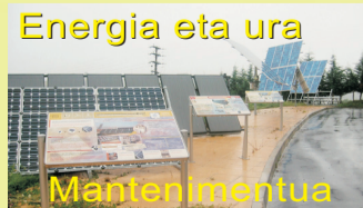
Energia eta ura Mantenimentua

Etarte bidea 9 (Zubieta) 20170 USURBIL - Tel.: 943 364 600 - e-mail: eskola@lhusurbil.com