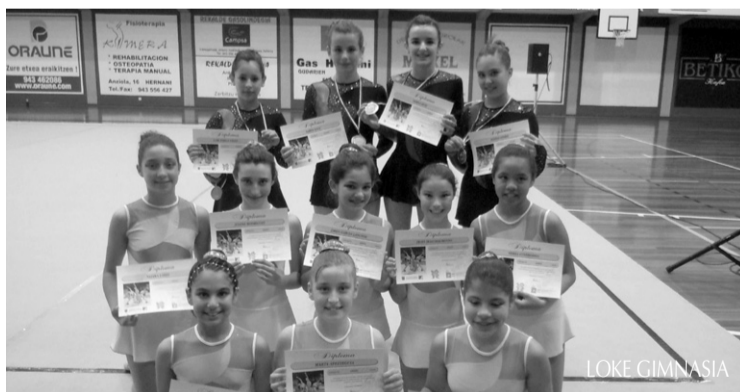
LOKE, Sasoeta eta Landaberriko taldeek lan ona egin zuten Udaberri txapelketan.