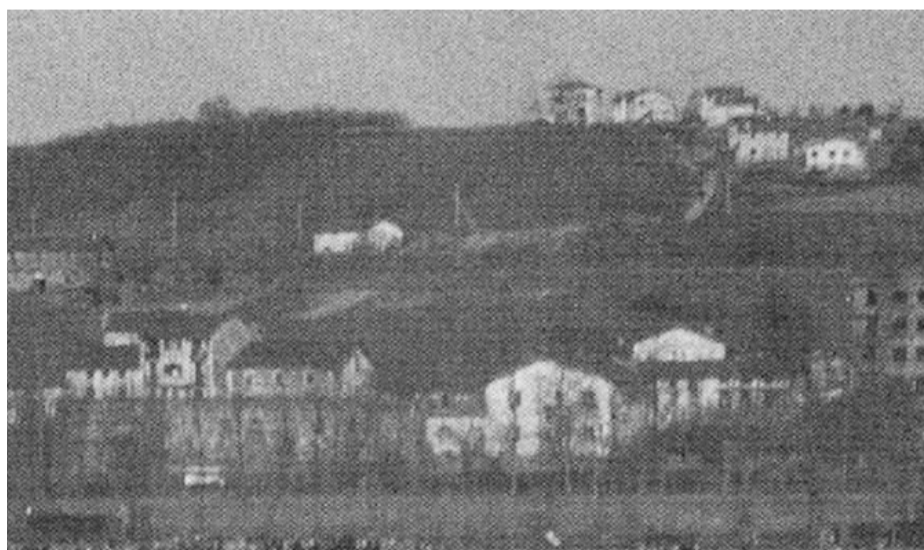
40. hamarkadako irudian goian eskubian, zelaia eta etxe batzuk kokatzen ziren egungo Zabaleta auzoan.