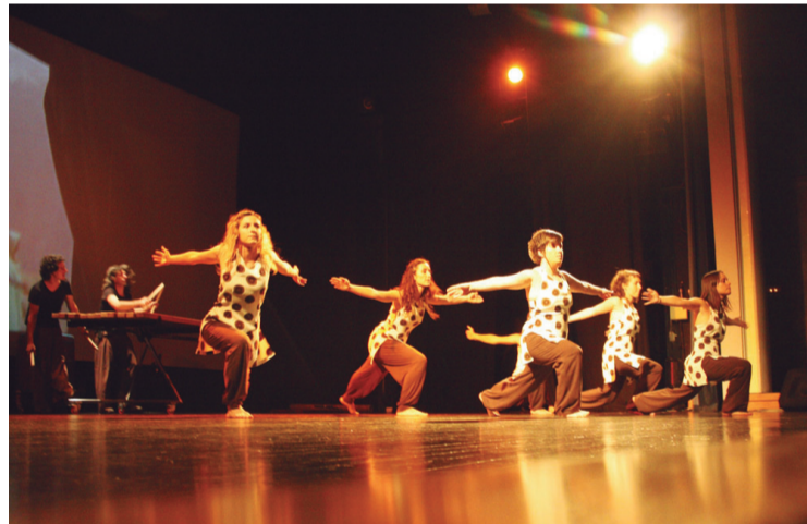
Adin tarte guztietako dantzariak oholtzaratu ziren, haur, gazte zein heldu.