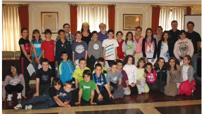
Eskolako Agenda 21-eko udalbatzar berezian parte hartu zuten gazteok irakasle eta udal-ordezkariekin batera.

Honela, besteak beste, gazteok zabor gutxiago eragiten saiatu eta sortzen