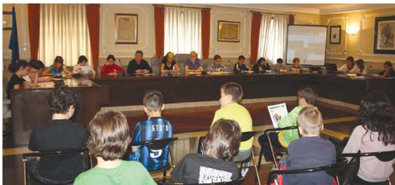
Landaberri eta Sasoeta-Zumaburu ikastetxeetako gazteek egindako lanaren ondorio eta proposamenak aurkeztu zituzten.