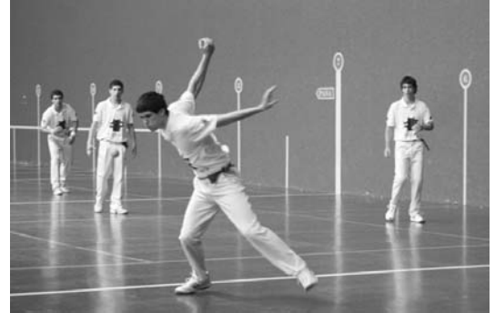
Lasarte-Oriako taldeak lan gogorra egin beharko du Donostiari aurre hartzeko.

Herri arteko eskupilota txapelketa duela bi aste hasi bazen ere, Lasarte-Oriak final zortzirenetan hasiko du ibilbidea faboritoetako baten aurka, Donostia. Etorriko partidak gaur, 19:00etatik aurrera Michelingo pilotalekuan jokatuko dira.