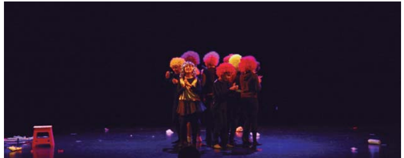
Landaberri eskolako haurrek asteartean antzeztu zuten "Goazen ilargira" lana Manuel Lekuonan.

Goizeko 9:00etan dultzai-neroen dianarekin hasiko da