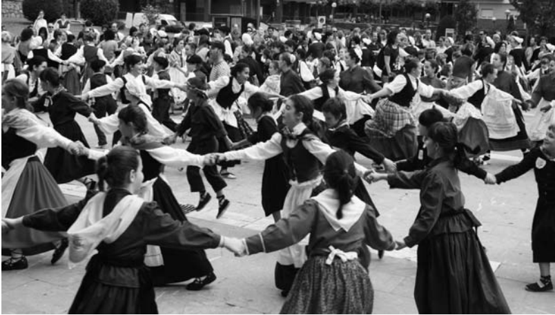
laz Andatza plazan ospatu zen Dantzari Txiki eguna, aurtengoan Okendora bueltatzen da jaialdi handia.