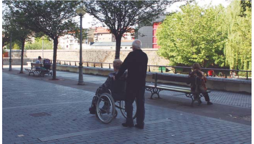
Zaintza egokiak emateko formazioa oinarrikoa delako antolatuta ditu udalak jardunaldi hauek.

Jardunaldien azken saioa maiatzaren 25ean izango da,