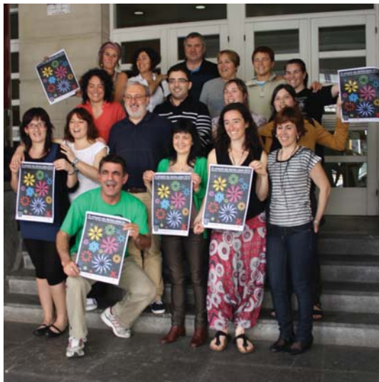
Udal ordezkarri eta Kukukako kideak, Hamabostaldiaren aurkezpenaren.

Osteguna, 17an Landaberri eta Sasoeta-Zumaburu ikastetxeko LH6ko ikasleen bi lan